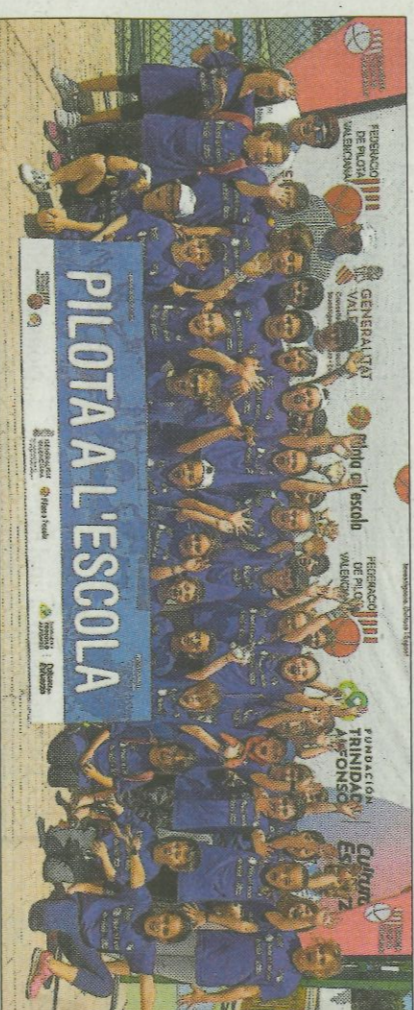
■ CEIP Ambra de Pego. FEDPIVAL