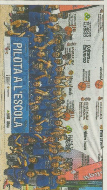
■ CEIP Santa Anna - Oliva. FEDIVAL