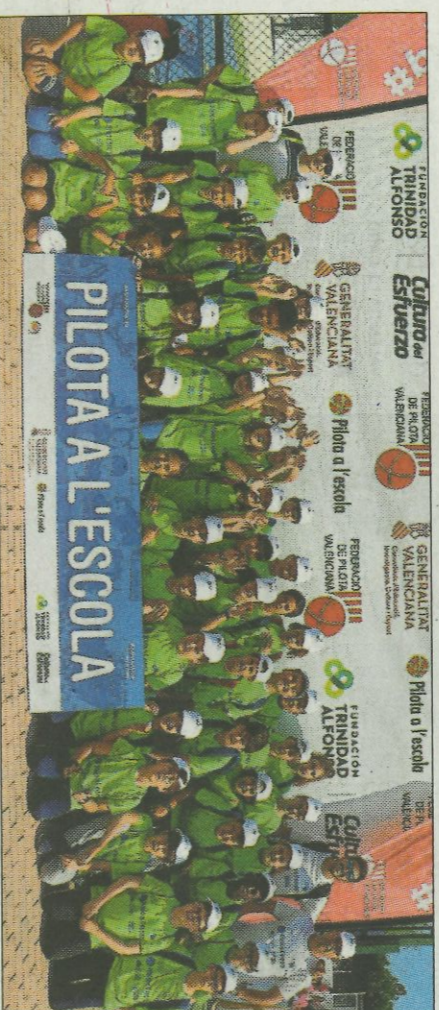
■ CEIP El Rebollet - Oliva. FEDPIVAL