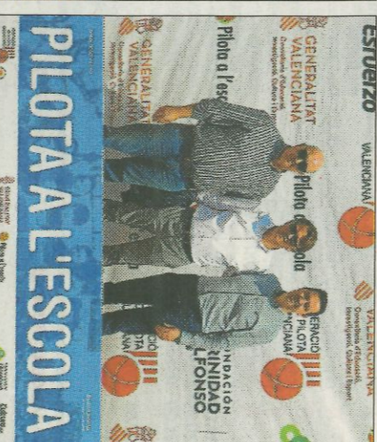
■ Les autoritats. FEDIVAL