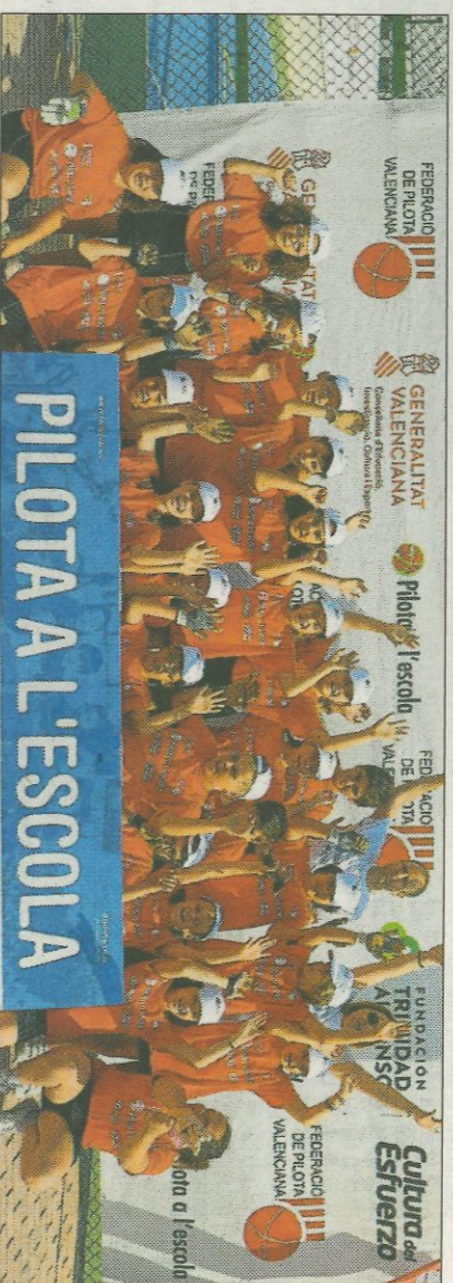
■ Col·legi Maria Immaculada - Xàbia. FEDIVAL