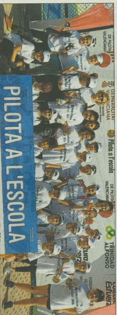
■ CEIP Desemparats - Oliva. FEDPIVAL