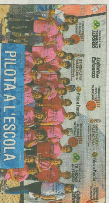
■ CEIP La Carrasca - Oliva. FEDIVAL