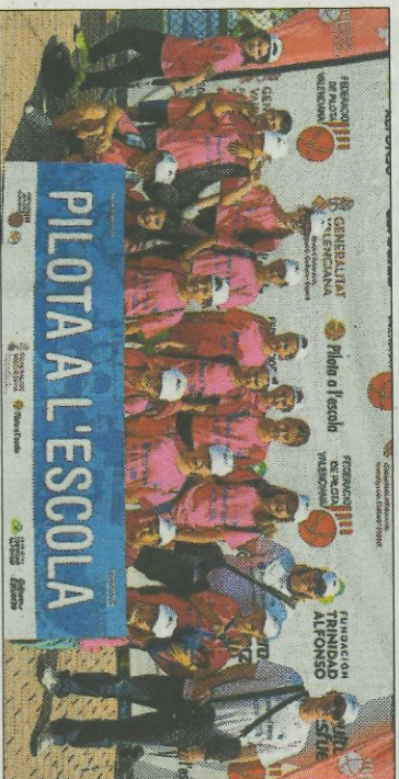
■ CEIP Alfaldí - Oliva. FEDPIVAL