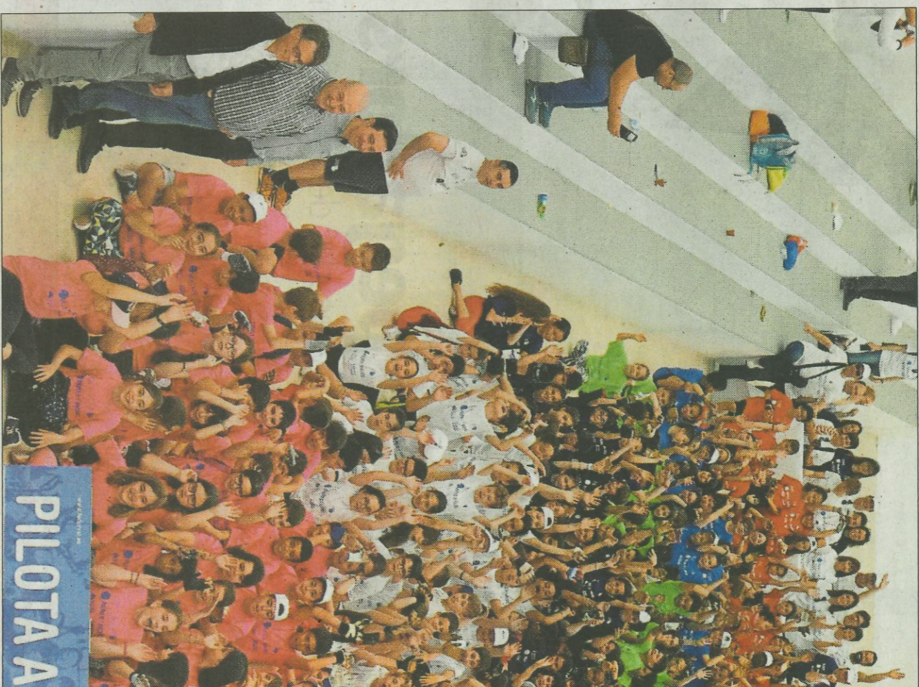
■ Foto de Grup - Trinquet de Piles.