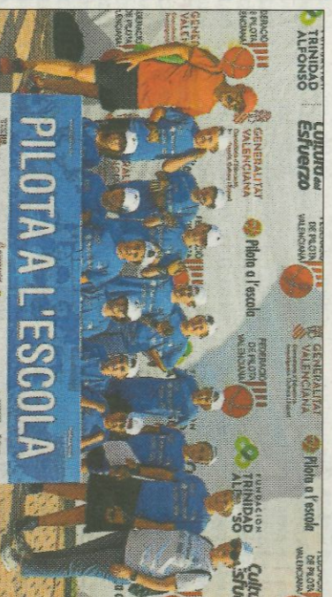
■ CEIP Sant Pere Apòstol - Alqueria Comtessa. FEDIVAL