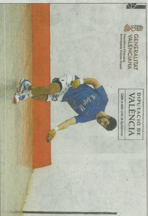
Badenes ha renunciat a disputar la prèvia per unes molèsties. FUMPIVAL

Després d'esta partida solament quedará una eliminatòria en la modalitat d'escala i corda. En principi n'eren dues, però l'organització ha anunciat que el duel entre Guillermo i Pablo de Sella programat el