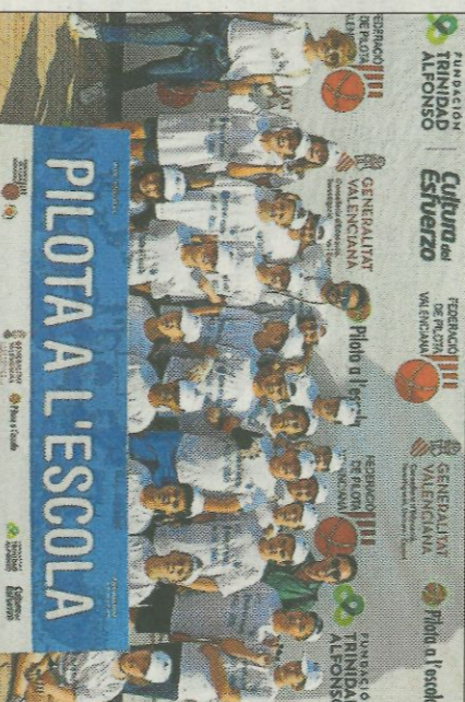
■ CEIP Lluís Vives - Oliva. FEDIVAL