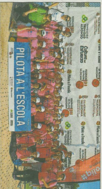
■ CEIP Hort de Palau - Oliva. FEDIVAL