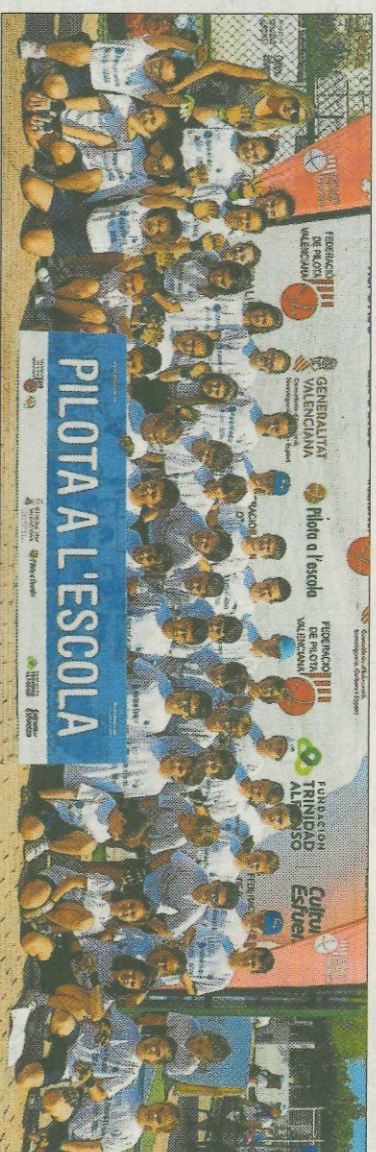
■ Col·legi La Encarnación - Sueca. FEDIVAL