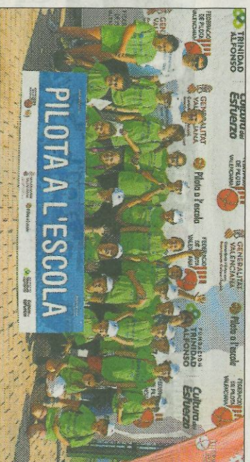
■ CEIP José Pedrós - Piles. FEDIVAL