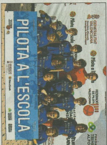
■ CEIP Benicadim - Beniarbeig. FEDPIVAL