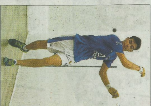
Vercher de Piles. FUMPIVAL

En la disciplina de raspall també s'ha suspès una eliminatòria, la prèvia per al pròxim dissabte a la Llosa de Ranes on s'anaven a enfrontar Badenes i Miravalles. El rest de Xeraco té unes molèsties que, si bé no l'impedeixen jugar partides en equip, sí que són suficientment importants com per a renunciar al mà a mà. Així les coses, el mitger del Genovés passa a huitens on es trobarà amb Punxa. La pròxima eliminatòria jugaran Tonet IV i Sergio el diumenge a Bellreguard.