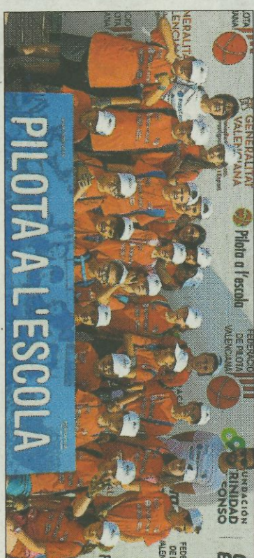
■ CEIP Francesc Carrós - Font d'En Carrós. FEDPIVAL