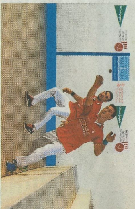
Alfara del Patriarca debutarà a una final de màxima categoria de trinquet. FPV

a salvar la categoria, ja que els queda per enfrontar-se amb els seus rivals directes, Massalfassar i Albuxech.