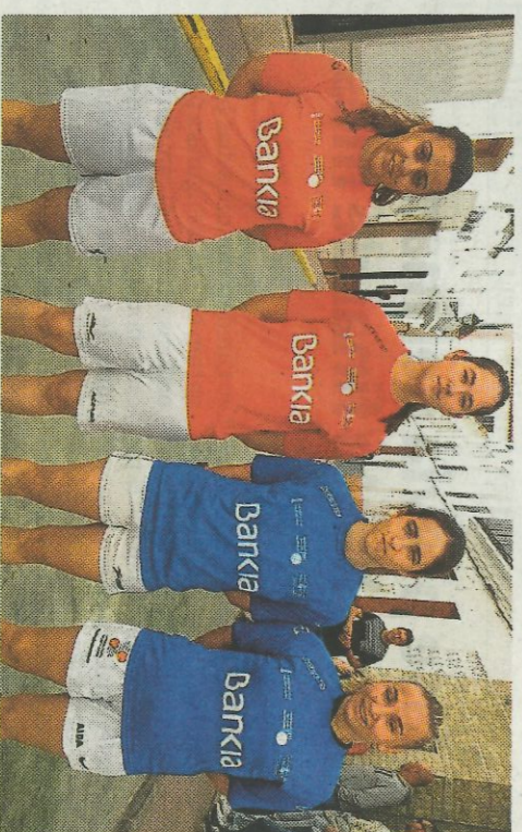
Alqueria d'Asnar i Bicorp A s'enfrontaran en la primera semifinal. FPV

en els obstacles del carrer, no aconseguien sumar res més positiu en la seua última partida del torneig. La classificació queda tal i com estava: Bicorp A en primera posició, seguit pel Beniparrell, mentre que Borbotó queda tercer, tancant les primeres posicions l'Alqueria d'Asnar. Les partides d'anada de semifinals tindran lloc el pròxim dissabte en el trinquet del club alacantí, i en elles s'enfrontaran Bicorp A amb l'Alqueria, i Beniparrell amb Borbotó.