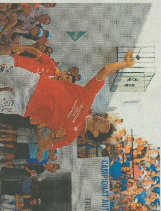
Foios, tot i les baixes, va guanyar al campió Quart de les Valls.