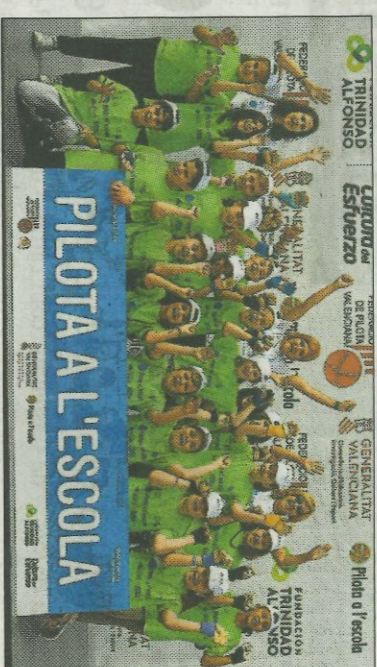
■ CEIP La Muralla - Canet d'En Berenguer. FEDPIVAL