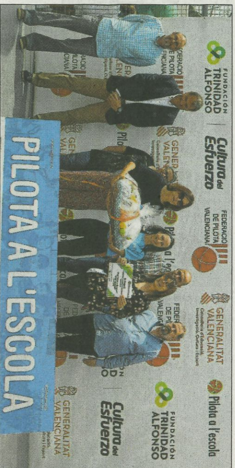
■ CEIP Albait - Primer premi treball pilota a l'escola. FEDPIVA