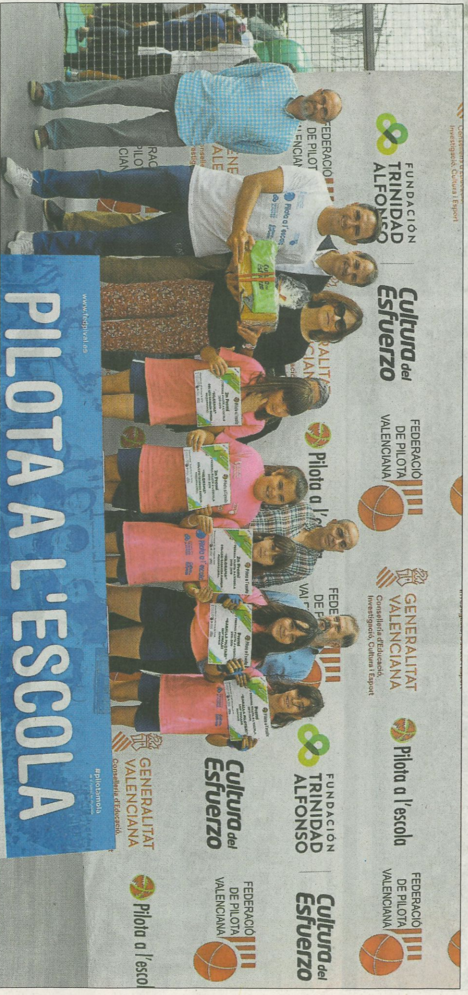
■ Col·legi Hernández campió competició secundària..