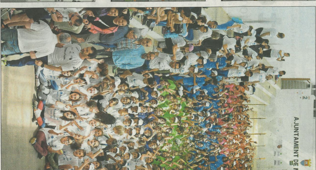
■ Foto de grup amb tots els participants FEDPIVAL