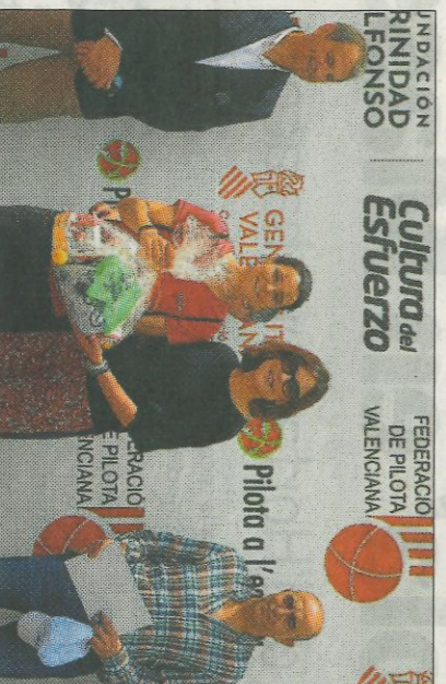
■ CEIP Cervantes d'Alcàntera - premi treball de pilota.