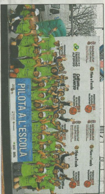
■ CEIP Albert Tomàs - Albuixech. FEDPIVAL