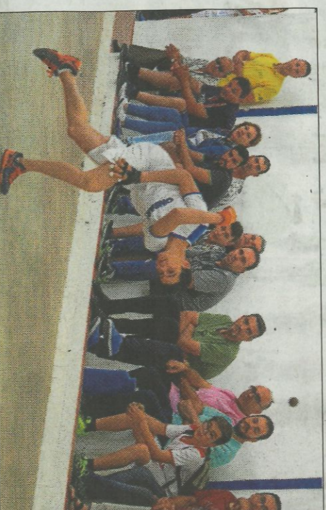
Els xiquets d'Ondara han triunfat al provincial d'Alacant. FPV