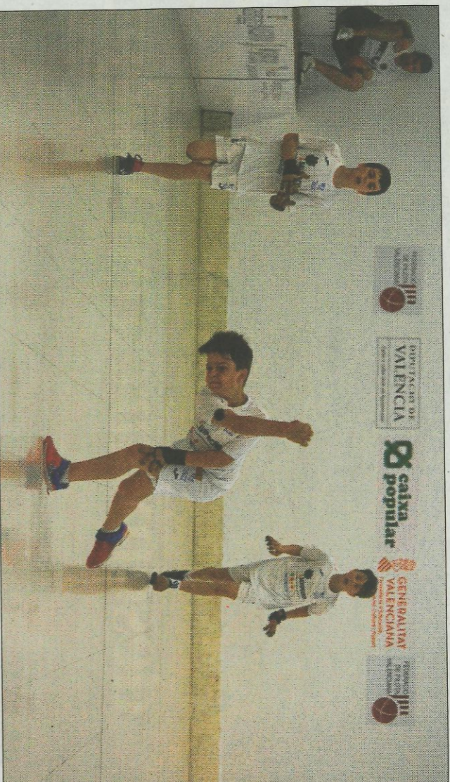
L'escola d'Oliva, una de les més fortes de València. FPV

Allarg del matí del dissabte tindran lloc les finals de les categories d'infantils, cadets i juvenils, i a la vesprada la jornada amb les finals de les categories de benjamí i alevins. La temporada passada els títols autonòmics els van guanyar: Ondara en la categoria benjamí, El Genovés en la categoria aleví, Beniarbeig-El Verger en la categoria infantil, Bellreguard en la categoria cadet i Alcàntera-Càrcer en la categoria juvenil. Cal destacar i agrair la col·laboració de l'Ajuntament i l'escola de pilota d'Ondara, per la bona predisposició per a albergar aquesta gran festa dels XXXVIII Jocs Esportius de Raspall amb les finals