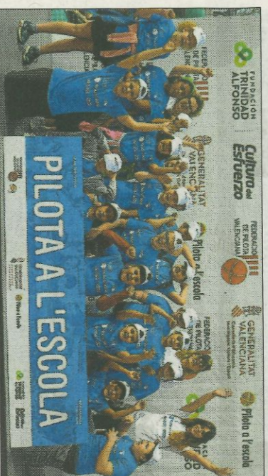
■ CEIP Gregori Mayans - Mislata. FEDPIVAL