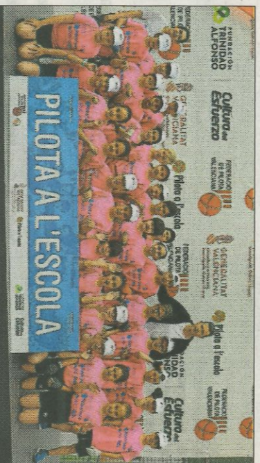
■ Col·legi Sagrada Família - Massamagrell. FEDPIVAL