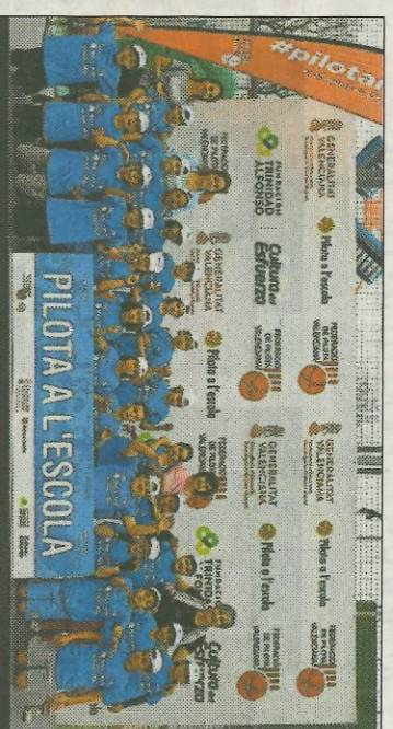
■ CEIP Dr. Vicente Trenchó - Moncada. FEDPIVAL