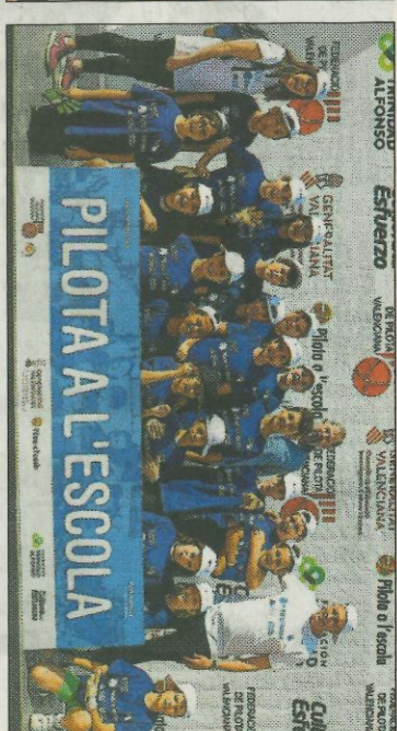
■ CEIP Ausiàs March - Alboraya. FEDPIVAL