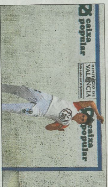
L'escola de Masamagrèl, la que més equips té a la final. FPV

■ Els XXXVII Jocs Esportius de Llargues comencen a Ondara i Agost aquest cap de setmana. Aquesta temporada els JECV de Llargues han augmentat la seua participació respecte a l'any anterior, amb 44 equips que jugaran enguany. Les escoles participants són: Agost, Alfàs del Pi, Beniarbeig-El Verger, Bendorn, Benimagrèl, Borbotó, Finestrat, València, Múria, Ondara, Orba, Pedreguer, Peter, Sella-Relleu, Vall de Laguardi Xàbia. La categoria benjamí és la que arranca aquest cap de setmana sent les finals el dissabte 22 de juny en la localitat d'Ondara, amb els millors equips.