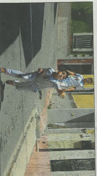
Cada any més xiquets juguen a llargues. FPV