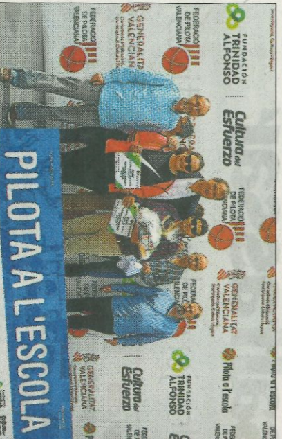
■ CEIP Trullas de Benifaió premi al treball de pilota.