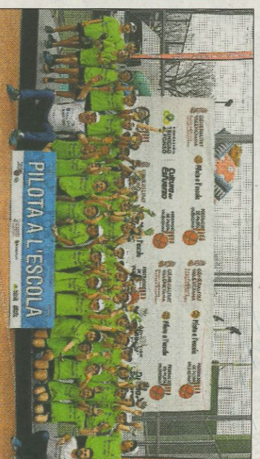
■ Col·legi Engelba - Valencia. FEDPIVAL