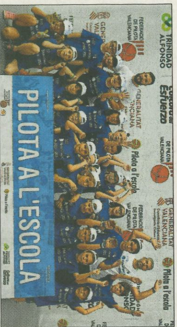
■ CEIP Casanova - València. FEDPIVAL