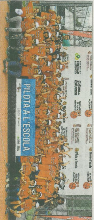
■ CEIP Verge del Pilar - Bonrepòs. FEDPIVAL