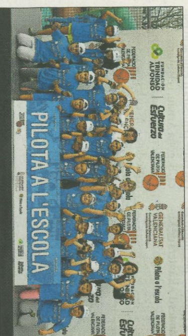
■ CEIP San Juan Ribera - Alfara del Patriarca. FEDPIVAL