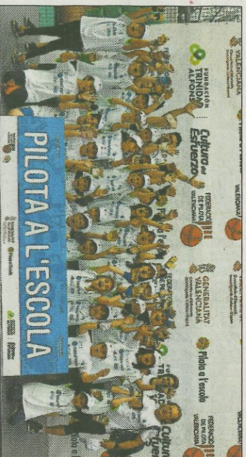
■ CEIP Blasco Ibáñez - Moncada. FEDPIVAL