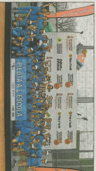
■ Col·legi Argos - Valencia. FEDPIVAL