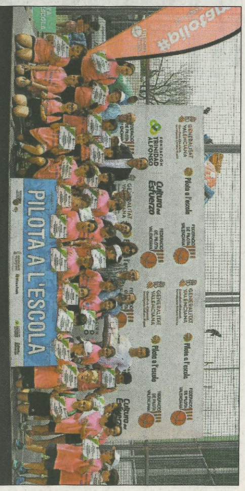
■ Sagrada Família - Segon premi treball pilota a l'escola. F.P.V.