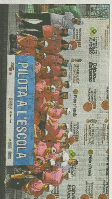
■ CEIP Rei En Jaume - Tavernes Blanques. FEDPIVAL