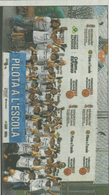
■ CEIP Sector Aéreo - València. FEDPIVAL