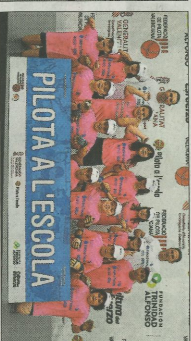
■ Col·legi Hernández - VV. de Castelló. FEDPIVAL