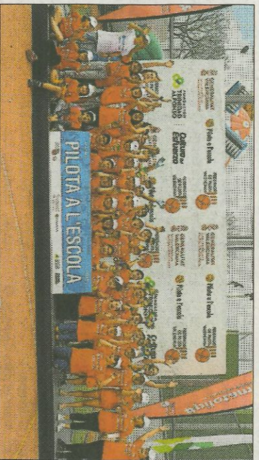
■ CEIP Miguel Bordonau - Burjassot. FEDPIVAL