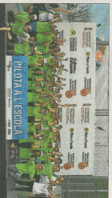
■ CRA La Serrania - Llosa del Obispo. FEDPIVAL