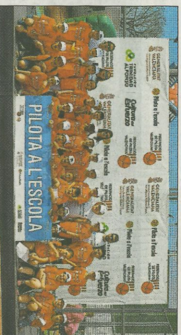
■ CEIP Ciutat Artista Faller - Valencia. FEDPIVAL