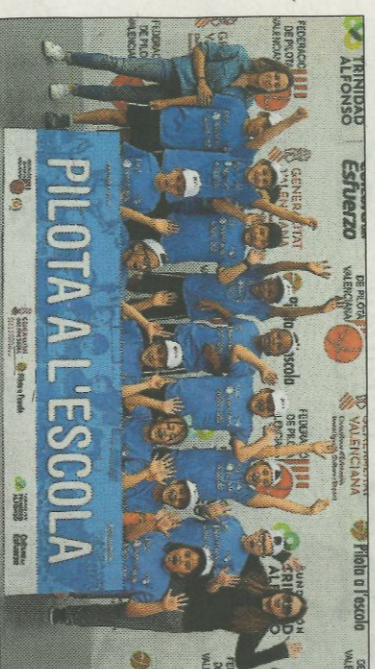
■ Col·legi Europa - València. FEDPIVAL