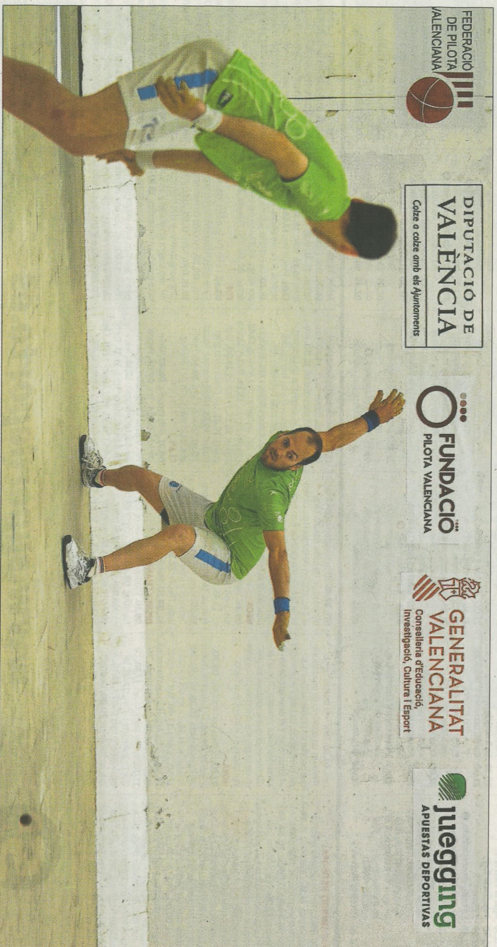
La victòria d'ahir deixa a l'equip que capitanega Sergio a un punt de la final de la modalitat de raspall. FUMPIVAL

La plaça vacant en la modalitat d'escala i corda es decidirà el diumenge a Xeraco en l'enfrontament entre els equips de Genovés II i Pere Roc II. Al primer també li bastaria amb fer 1 punt per a continuar endavant. L'opció per a l'escalerer de Benidorm és guanyar amb un resultat folgat i classificar-se per millor coeficient de jocs.