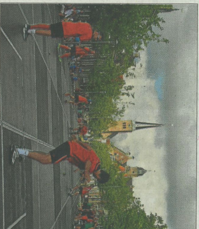
La selección valenciana en el Europeo de Holanda.

Sólo un movimiento enraizado en el romanticismo, a finales de los años setenta, recuperó en algunos lugares el viejo juego de pelota, ya denominada como «valenciana» prácticamente desaparecida. En Valencia, en tierras vascas, y en otras pocas regiones europeas se conserva el viejo deporte apegado al sentimiento de identidad. Pero ese sentimiento no es suficiente para motivar a aquellos que están alejados de ese sentir o sim-