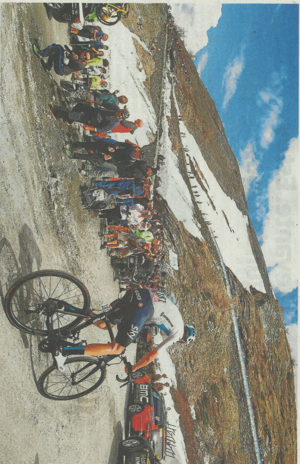
La mejor etapa de 2018, cuando Froome aplastó a Simon Yates sobre la tierra de La Finestre.