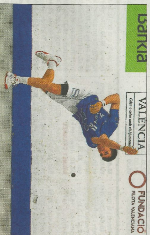
Salles II jugarà mà a mà contra Vicent a Bellreguard. FUNPIVAL

A més d'esta nova competició oficial també hi ha a la vista dues partides de les quals solen omplir els trinquets, els desafiaments. Cu-