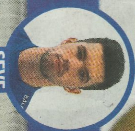
SEVE POSICIÓN: MITGER EDAD: 19 TÍTULOS/FINALES: 0/0