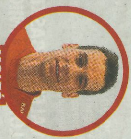
MOLTÓ POSICIÓN: RESTO EDAD: 26 TÍTULOS/FINALES: 1/3