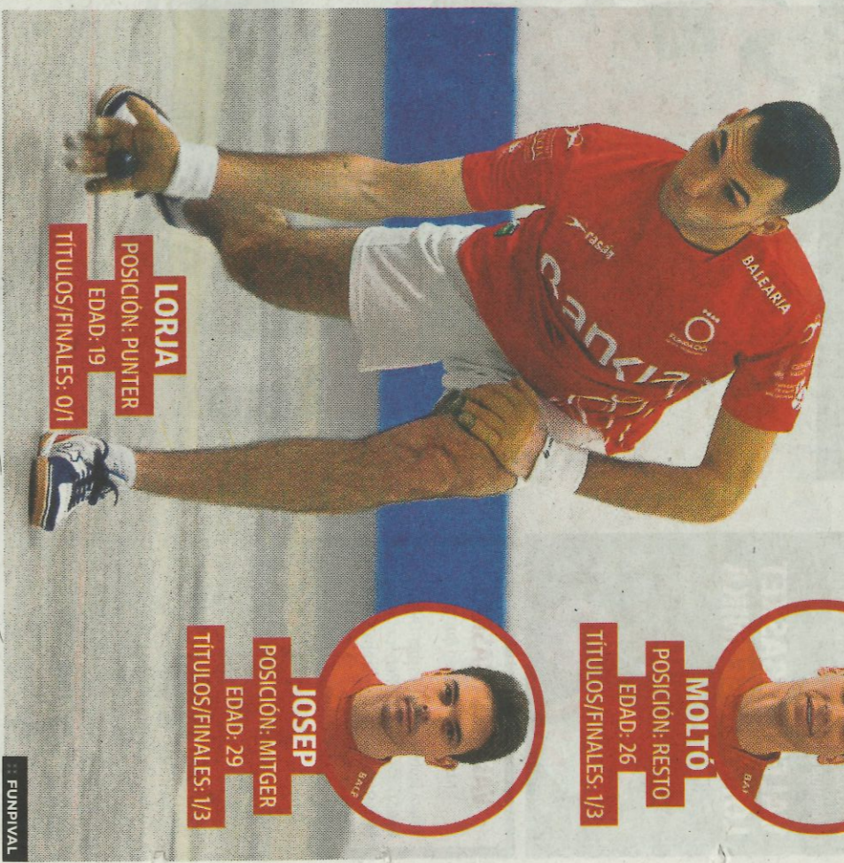
LORJA POSICIÓN: PUNTER EDAD: 19 TÍTULOS/FINALES: 0/1