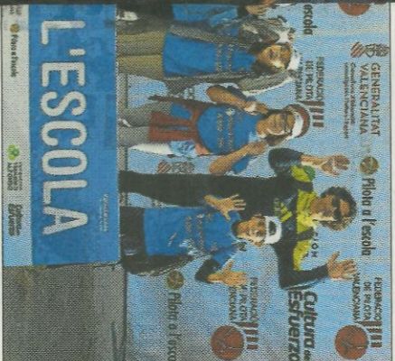
CRA Escolles del Xàquer-Gavarda. FEDPIVAL