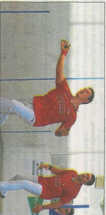
La present edició d'El Corte Inglés està sent molt disputada. FPV

Aquesta jornada les partides es jugaran totes demà dissabte. En el cas de l'enfrontament entre Lanzadera Montserrat i Albuxech A, cuer del grup, la partida es disputarà en la canxa de Montserrat a les 16:30 hores. A les 16 hores s'enfrontaran el Kiwa Quart A i l'ajuntament de Beniparrell A en el ca-