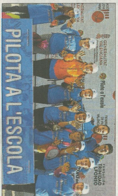
CEIP Cervantes-Alcàntera del Xàquer. FEDPIVAL