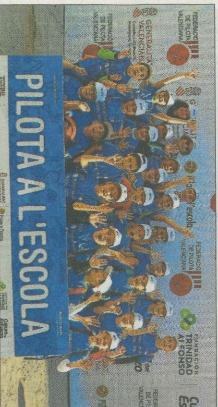
CEIP Emili Lluna-Muro. FEDPIVAL