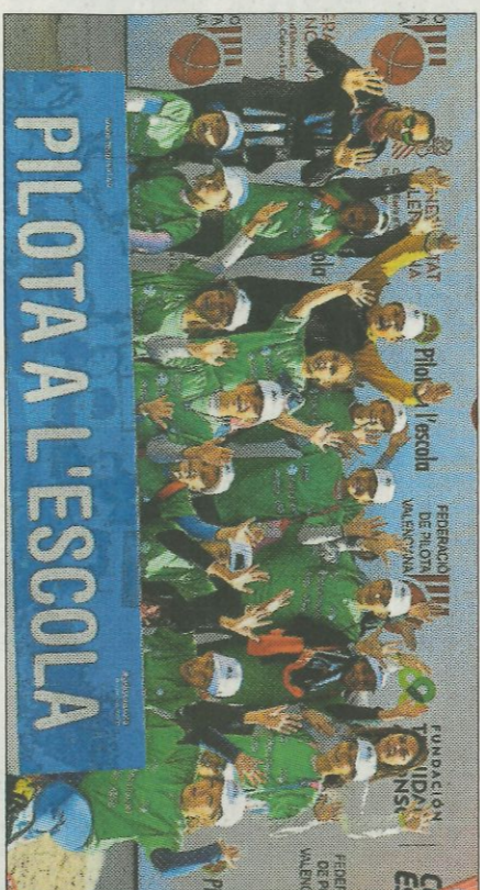
Ntra. Sra. de la Seo-Xativa. FEDPIVAL