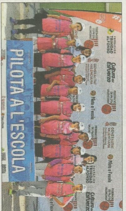
CEIP Los Pinos-Bicorp. FEDPIVAL