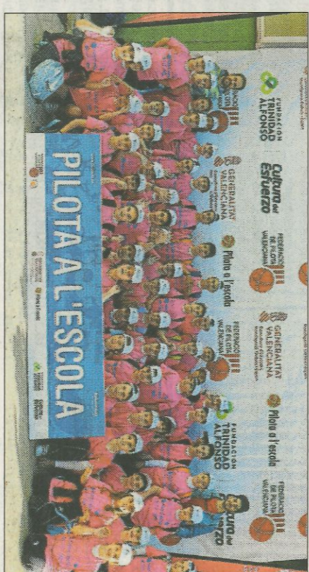
CEIP Cervantes-Alcàntera del Xàquer. FEDPIVAL