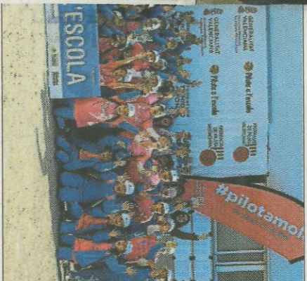
CEIP Los Pinos-Bicorp. FEDPIVAL