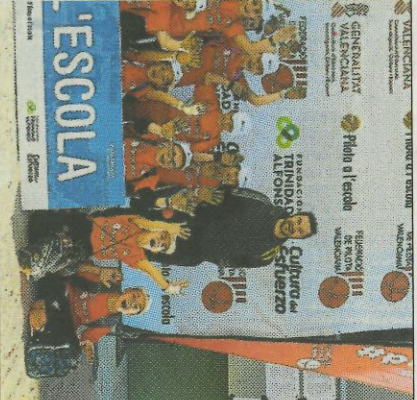
CEIP Cervantes-Alcàntera del Xàquer. FEDPIVAL