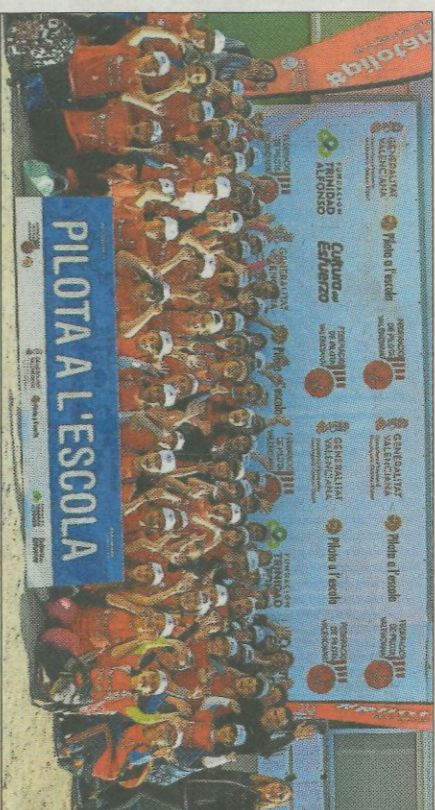
CEIP Jacinto Castañeda-Xàtiva. FEDPIVAL