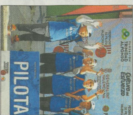
CEIP Pare Guinilla-Càrcer. FEDPIVAL