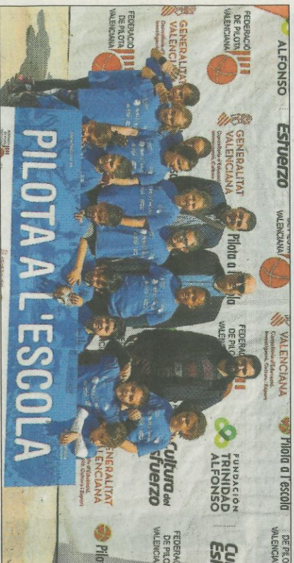
Autoritats presents en la trobada de Canals.