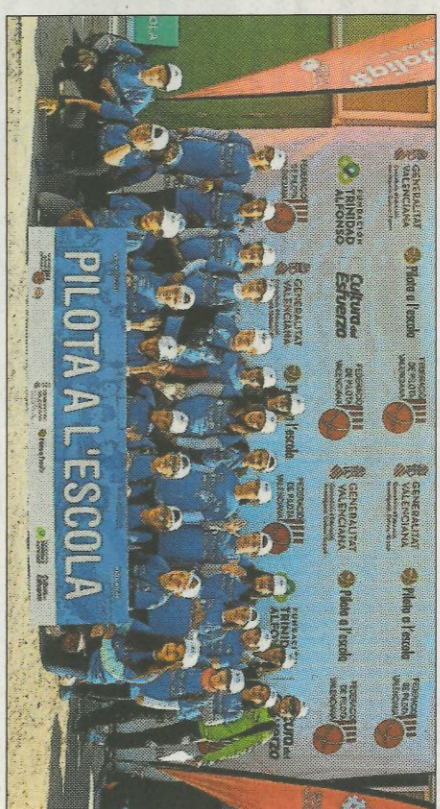
CEIP San José Calassanz-Navarres. FEDPIVAL