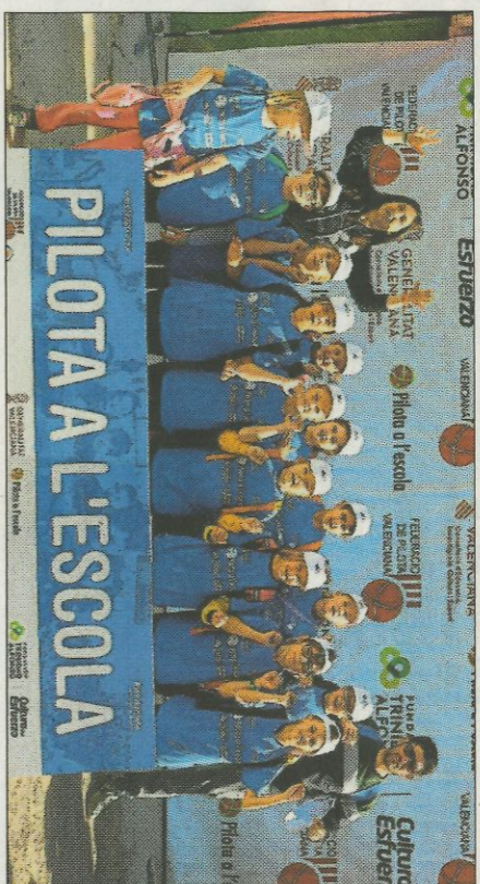
CEIP Salvador Andrés-Algemesí. FEDPIVAL