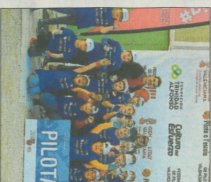
CEIP José Molla-Canals. FEDPIVAL