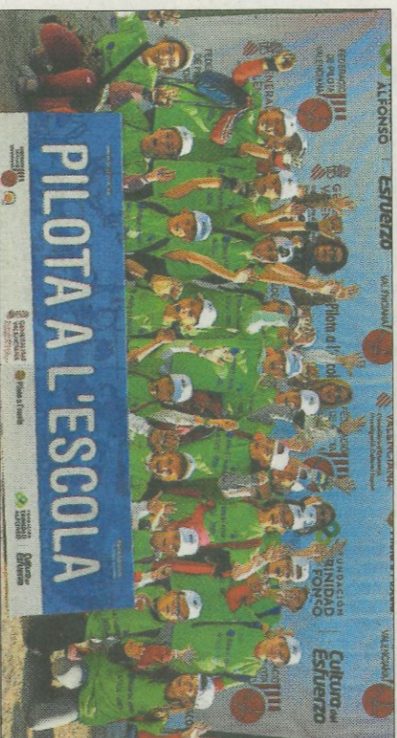
CEIP Mestre D. Jaime Aparicio Pérez-Anna. FEDPIVAL