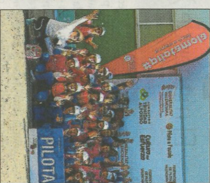
Col·legi Claret-Xàtiva. FEDPIVAL