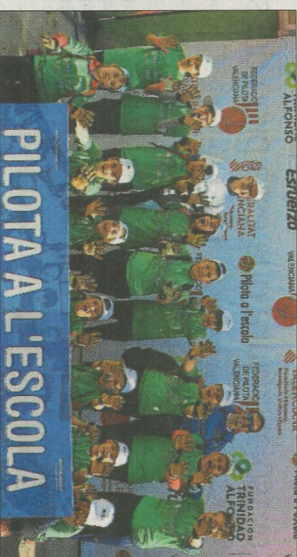
CEIP Santa Bàrbara-Tous. FEDPIVAL