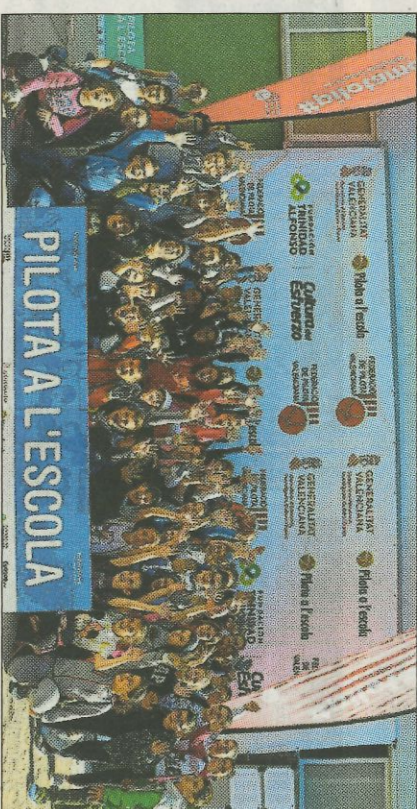
CEIP Bracal-Muro. FEDPIVAL