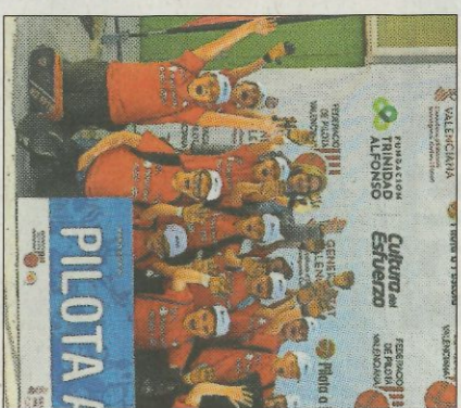
CEIP Ausiàs March-Llutxent. FEDPIVAL