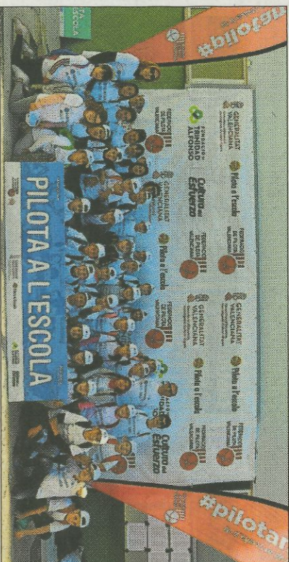
CEIP Beata Inés-Benigànim. FEDPIVAL