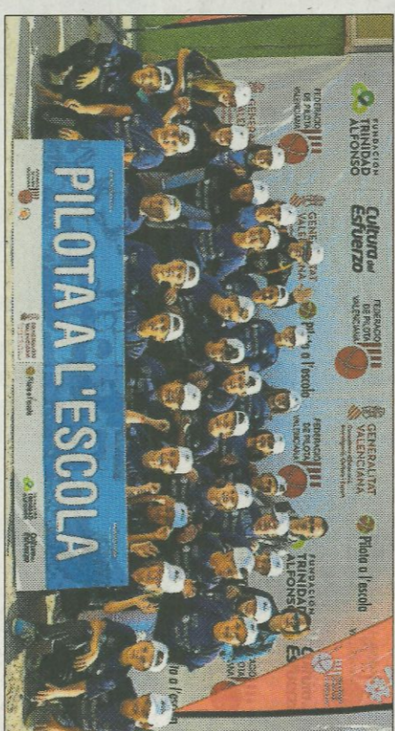
CEIP Los Pinos-Bicorp. FEDPIVAL