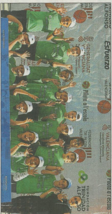
CEIP Albait-Bolbait FEDPIVAL