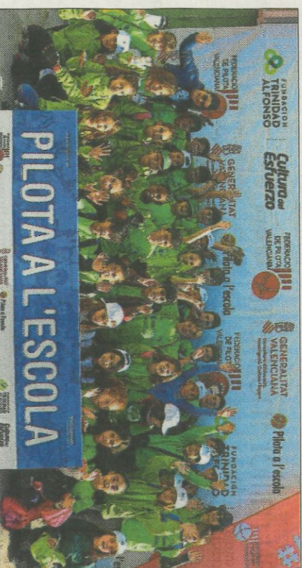
CEIP San Juan Bosco-Ontinyent. FEDPIVAL