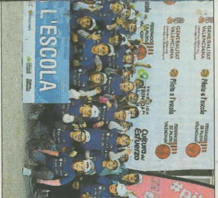
CEIP La Xarquia-Antella. FEDPIVAL