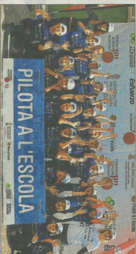
CEIP Padre Moreno-Moixent. FEDPIVAL