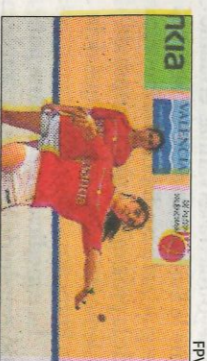
Bicornp descansa esta setmana.