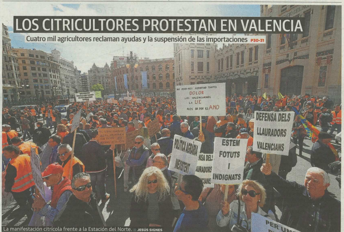
La manifestación citrícola frente a la Estación del Norte.

Cuatro mil agricultores reclaman ayudas y la suspensión de las importaciones P30-31