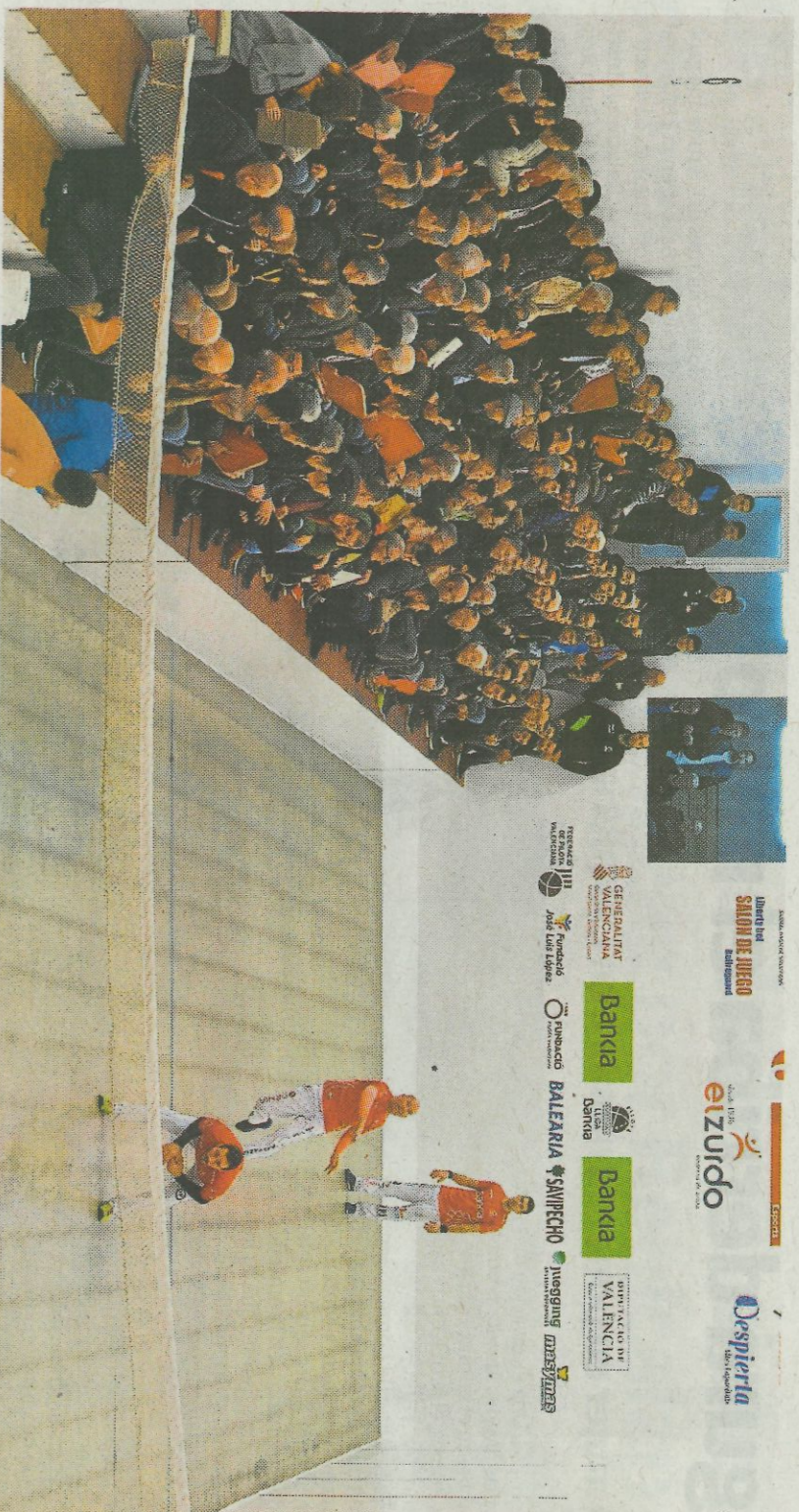
Un instante de la semifinal de escala i corda disputada el domingo en el trinquet de Bellreguard.