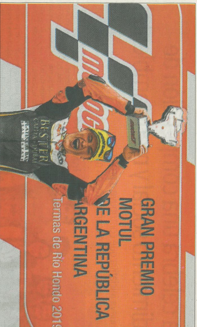
Jaume Masia levanta el trofeo en el podio del circuito argentino de Termas de Río Hondo. DPP