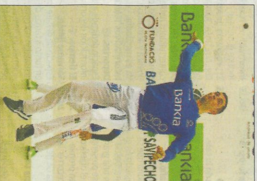
Pere, ahir a Bellreguard. FVP

En el començament, els dos trios van igualar en joc, nivell i intenció. L'ajustat 60-50 de l'anada obligava a eixir concentrats i sobretot a no errar, amb la qual cosa prevaliden les pilotades llargues que obligaven als mitgers a fer-se enrere i als escalers a mostrar les seues virtuts. De la Vega buscava més l'aire amb qualsevol de les dues mans mentre que Francés tirava de tirallines en