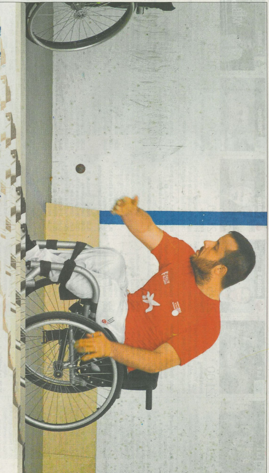
Salva de l'Alqueria durant una partida de raspall adaptat. FEDERACIÓ