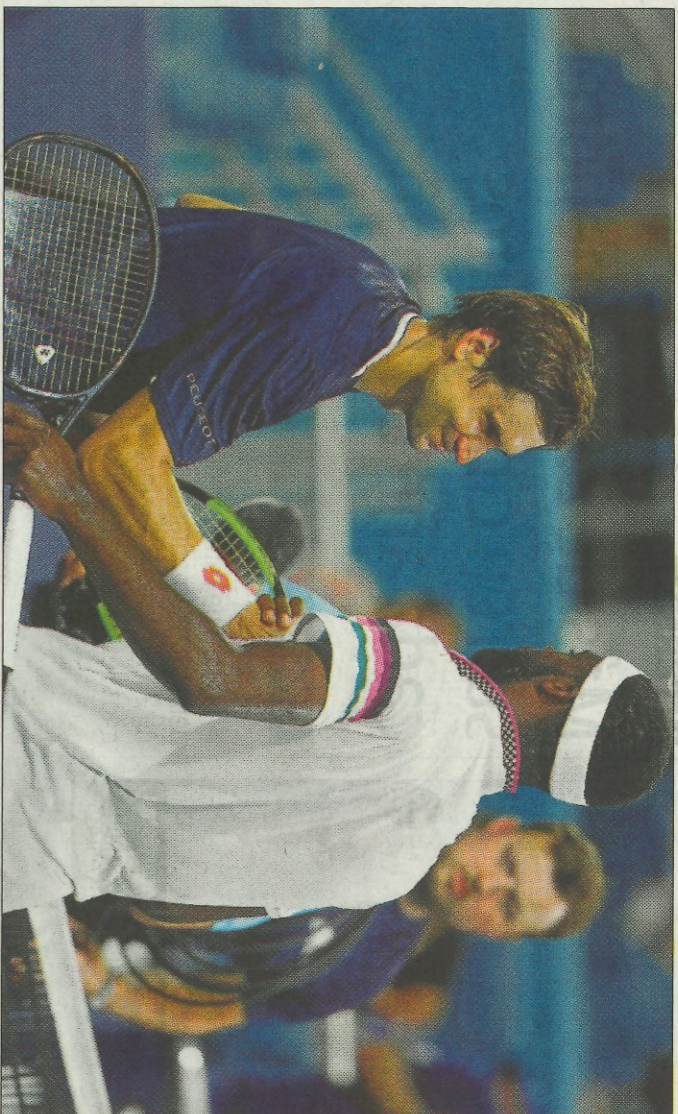
Ferrer saluda a Tiafoe tras caer derrotado en la tercera ronda de Miami.