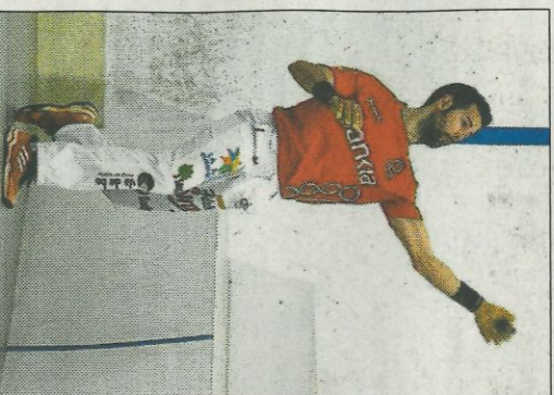
Pere Roc II juga hui a Sueca.

En els primers compassos van manar els de casa, però els dos jocs de diferència van ser neutralitzats per De la Vega i els seus companys. I a partir de la igualada a 30 es va sumar de manera quasi alternativa, encara que de tant hi havia un equip que trencava des del rest. En el tram final, els detalls i la millor definició van decidir la partida. La tornada es jugarà el pròxim diu-