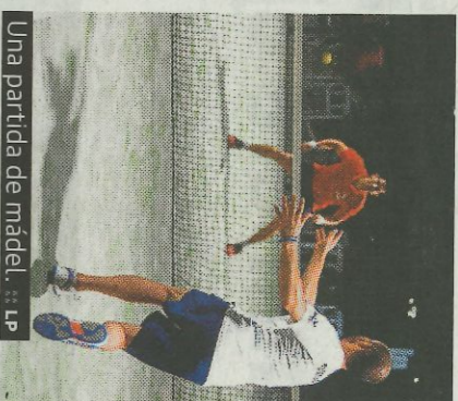
Una partida de Mádél. R. D. LP

las ocho mejores parejas. El formato del Circuit será el mismo que en ediciones anteriores, en cada torneo se repartirán un número de puntos desde los 5 por participar, 15 a los semifinalistas, 20 a los finalistas y 25 a los campeones. El certamen cuenta con más de 2.000 euros en premios repartidos en cada cita y en la clasificación general. El Mádél es una modalidad de pelota a mano ideada en la Comunitat que se juega en canchas de pàdel.