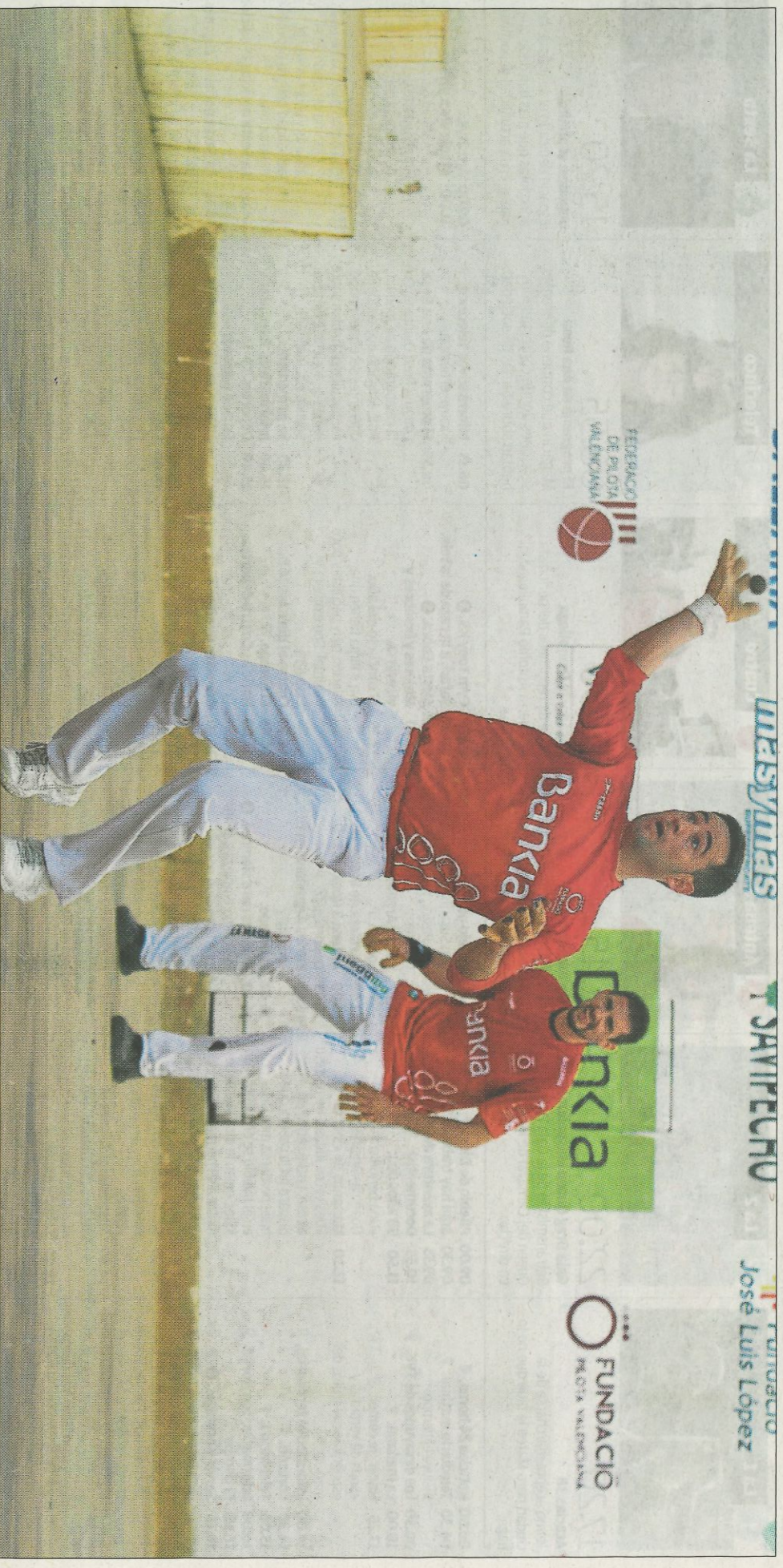
Jesús pronostica partides de desenllaç amb iguals a 55 o 60-50 en les semifinals de la Lliga d'escala i corda. FIMPIVAL