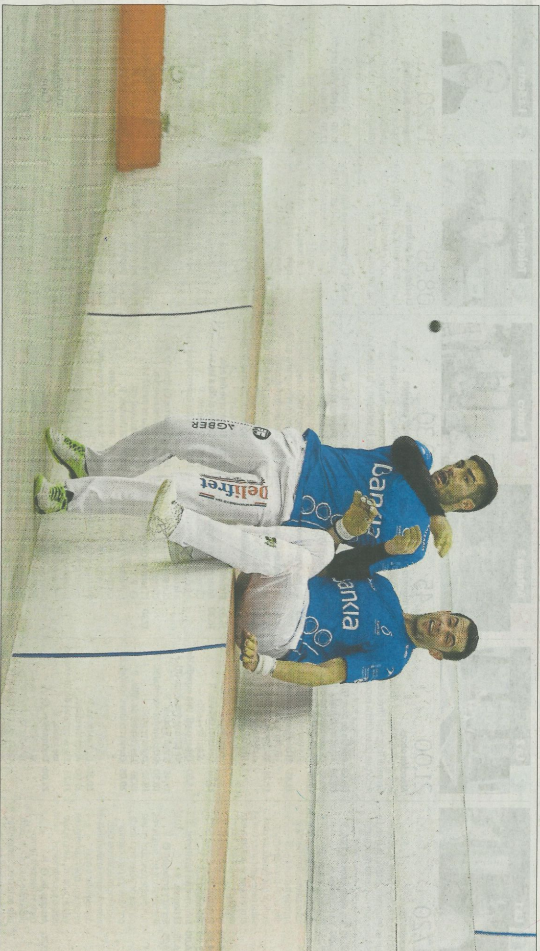
Francés colpeja una pilota dividida en un moment de la partida disputada ahir al trinquet de Guadassuar.