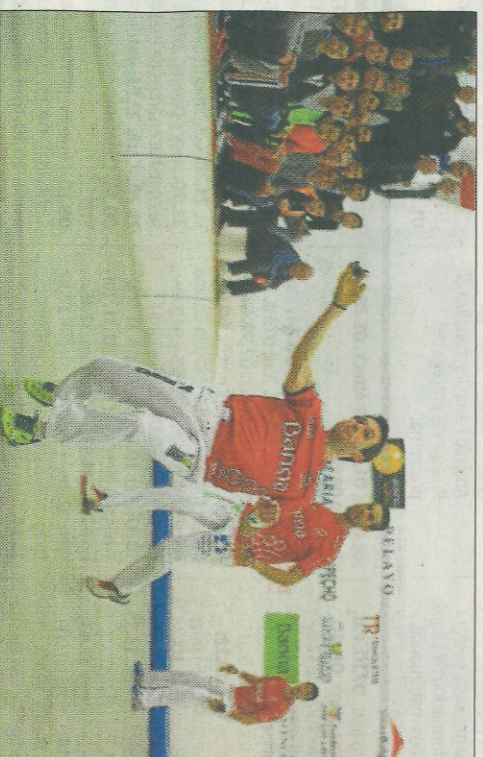
Lequip de Muria ha està eliminat de la Lliga d'escala i corda. FUMPIVAL

Prou més desnivellats van estar els cara a cara entre mitgers i pun-