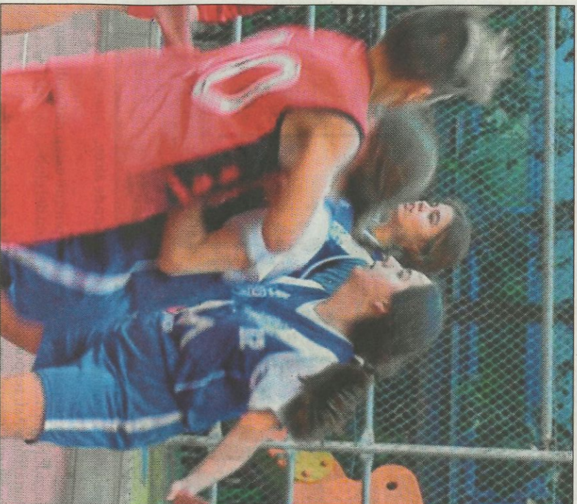
Imagen de un partido de las ligas mixtas de baloncesto.

La FDM subraya, efectivamente, el carácter no competitivo de los Juegos Escolares, a los que se sumaron este año las categorías juveniles. «Las categorías se estructuran por edades, como en el colegio, y el sistema de competición busca igualar el juego por nivel sin tener en cuenta el género», argumenta Orts, que recuerda que los equipos que se han inscrito en estas ligas, ordenadas desde la FDM pero gestionadas por la Federación de Baloncesto de la Comunidad Valenciana, «lo han hecho con total libertad, conociendo las condiciones de la com-