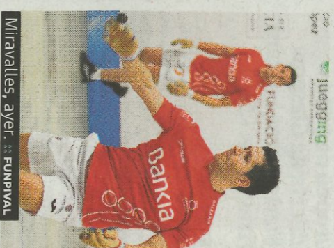
Miravalles, ayer. FURNIVAL

El equipo de Pablo comenzó bien desde el dau, a tumba abierta, sabedor de que sus opciones pasaban por ganar de forma holgada. Pero en cuanto pasaron al trauce los roles, la partida se decantó a su favor. El equipo de Ian continúa en puesto de eliminación, aunque con los mismos puntos, ocho, que el trío de Sergio, que hoy se mide al de Montaner en Bellguard.