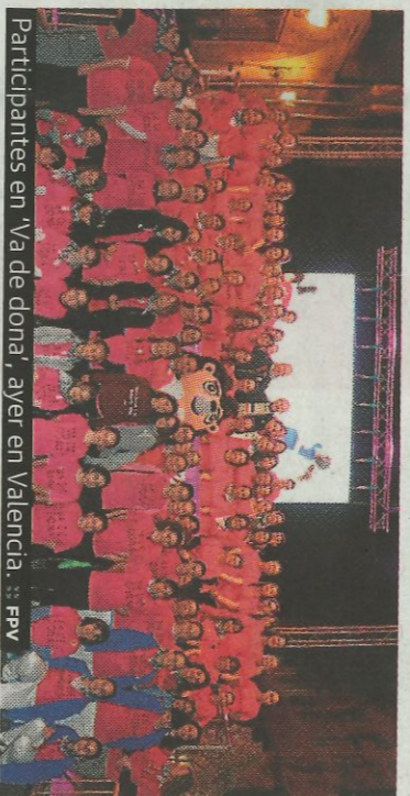
Participantes en 'Va de dona', ayer en Valencia. FPV