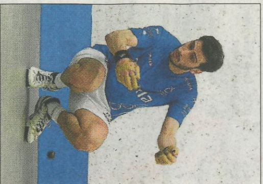
Canari, ahir al Genovés.