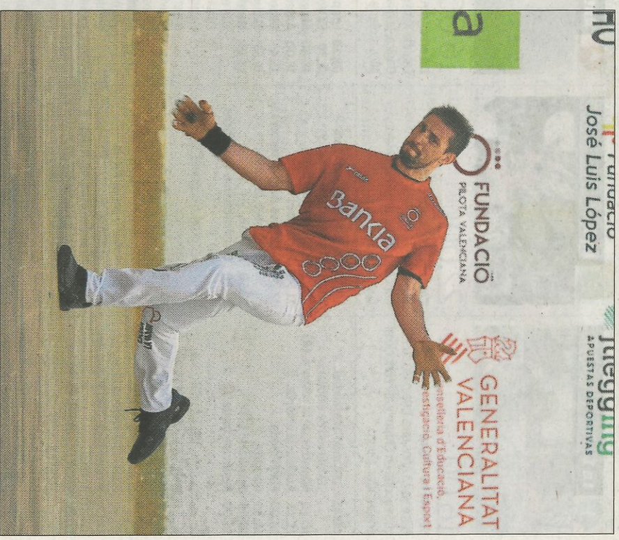
Soro III està més lluny de les semifinals de la Lliga d'escala i corda. FVV