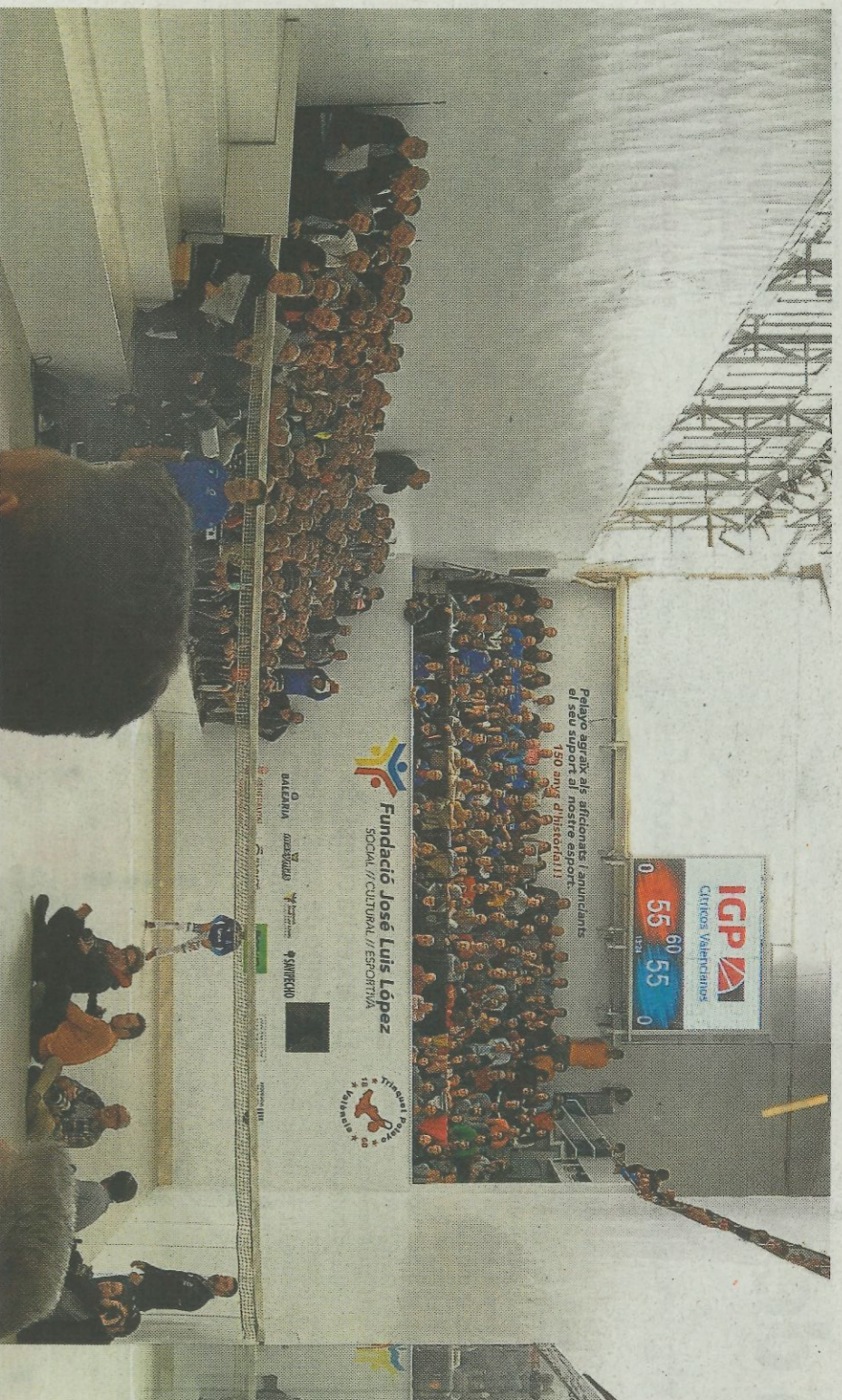
Ultra se dispone a ferir, al lado de una cámara de televisión, en la final del Individual, que emitirá À Punt. ** M. R.