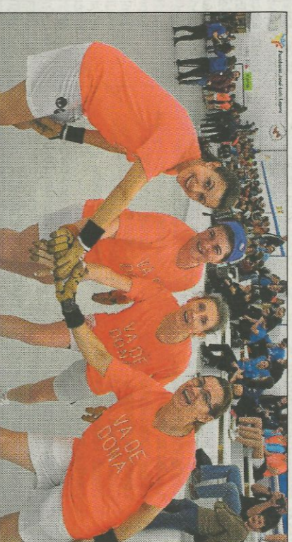
Moltes jugadores volen participar en 'Va de dona'. so

Les activitats tindran lloc en diversos dies i llocs, en la Petxina es podrà visitar una exposició fotogràfica, es retransmetran finals en locals de Benimaclet. Sent la festa grossa en l'entorn de la Generalitat el divendres 1 de març, a partir de les 16:00 h., en la plaça Manises es farà un concert, un correfoc, una fira d'artesanía de pilota...; jugant-se a pilota en els carrers adjacents.