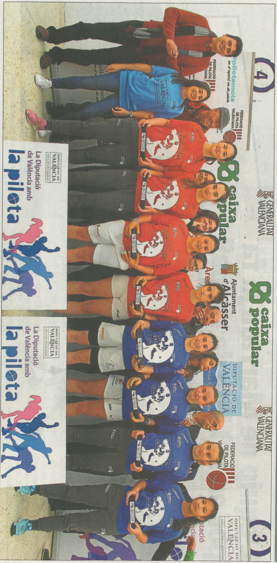
Lliurament de trofeus de les finals dels Circuits de tecnificació. SD