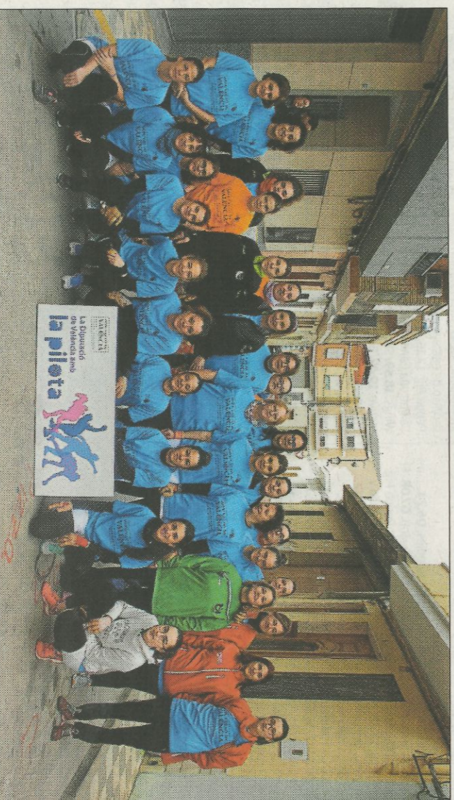
Jugadores senior a la trobada d'Alcàsser. so

També les autoritats d'Alcàsser van gaudir de l'excursionista ambient d'aquesta gran jornada que tots van qualificar com a espectacular.