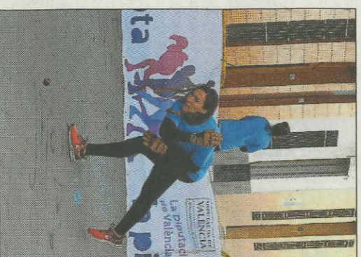
Jugadores de totes les edats. so

nos, Font Carrós, Finestrat., convertint la jornada en la més nombrosa de les que s'han organitzat en els últims anys.