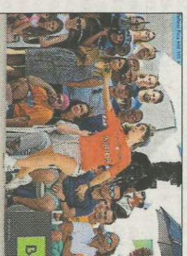
Victòria de València. so