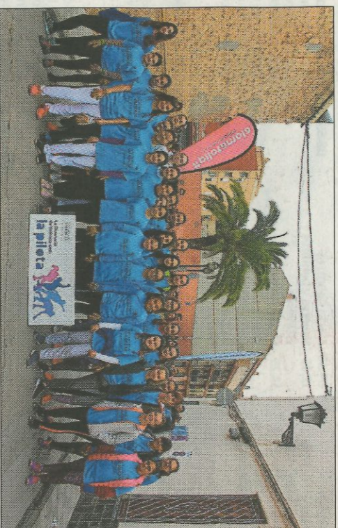
Les jugadores de les escoles també van participar. so

En la trobada femenina d'Alcàsser van participar les escoles de: Almassora, Tavernes Blanques, Valencia-Pelayo, Valencia-Tomas de Montañana, Moixent, Oliva Santa Anna, Bicorn, Genovés, El Campello, Alcàsser, Almassora, Amics de la Ribera, Beniarbeig-El Verger, Godelleta, Marquesat, Quatretonda, Rafelbunyol, Valencia-Fornos, Valencia-Patruix, Xaló, Moncada, Torrent, Favara, Massalfassar, Montserrat, Vall de Laguar, Algemesí, Xúquer-Sueca, Valencia-La Font, Algimia Alfara, Santa Teresa, Casi-