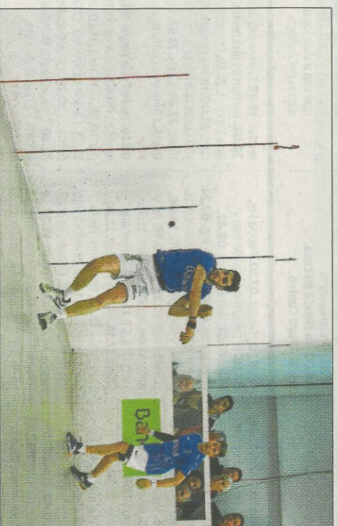
A Xeraco se li ha posat molt costera amunt la classificació. FUMPIVAL

Amb la victòria, Montaner i els seus companys se situen segons en la taula de la Lliga Bankia de raspall amb 8 punts, 2 per davall dels líders, Moltó, Josep i Llorja. Pablo, Canari i Raulí es queden com estaven, cuers amb solament 1 punt. La resta d'equips es mouen entre els 7 i els