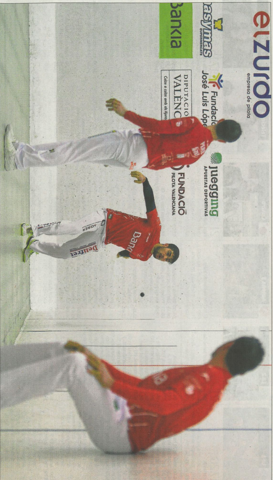
La formació de Pedreguer va aconseguir victòria a Bellreguard contra l'equip representatiu d'Almussafes. FUMPIVAL