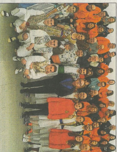
Integrants de les falles de Pelayo.