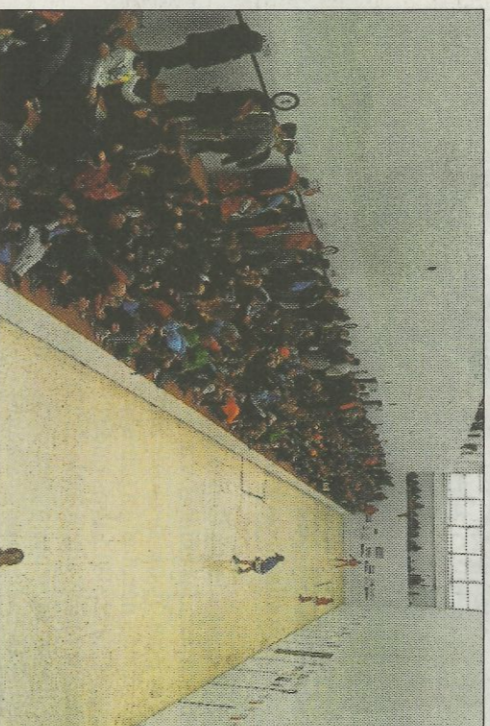
Trinquet d'Alcàsser ple, de gom a gom.

Més de vint anys acudint religiosament a la manifestació esportiva més estesa i entranyable del món faller i algú va pensar que no era necessària la presència de la fallera major en la final del Joc de Pilota. Trista decisió. Síntoma preocupant. Les mirades es dirigeixen, inevitablement cap al regidor responsable de la Junta Central Fallera. No han fallat les gents de les comissions - un total de 49 inscrites en el torneig -, no han fallat els pilotaris, ni els seguidors que han acudit en gran nombre a disfrutar de la jornada. No ha fallat el Trinquet de Pelayo,