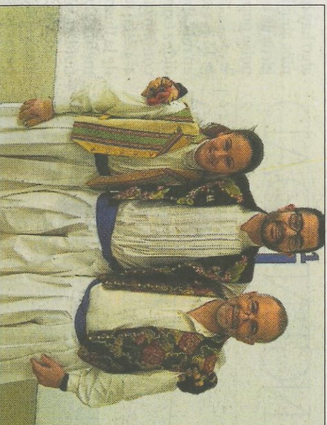
Equip familiar.