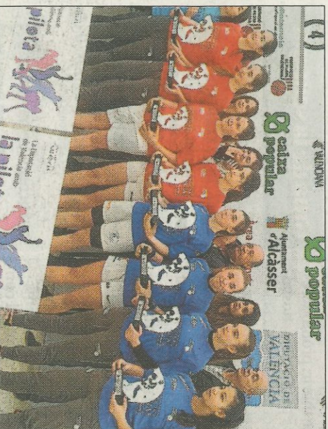
Campions a Alcàsser.