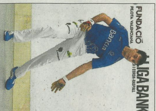
Genovés II, ahir a Pelayo. FUMPIVAL

A mesura que passaren els jocs eixes jugades de qualitat que acostumen sis de les figures més reputades van ser menys nombroses. I com que les errades es mantien, una cosa no tapava tant a l'altra