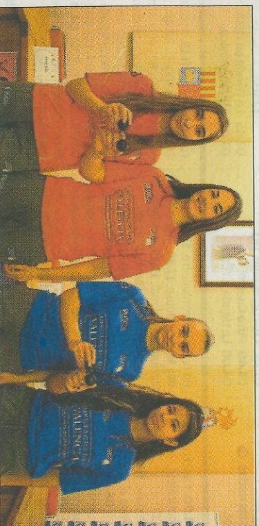
Tres debutants a la competició estan a la gran final del sub-18.