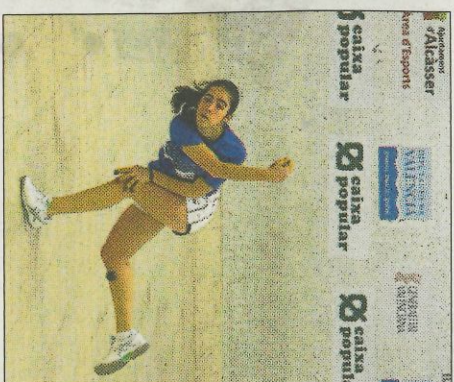
Primera gran final de Victòria. F. P. V.

A partir de les 12 hores, en la final del sub-23, s'enfrontaran l'equip de Victòria del CPV Rafelbuñol i Fanni del CPV El Verger contra