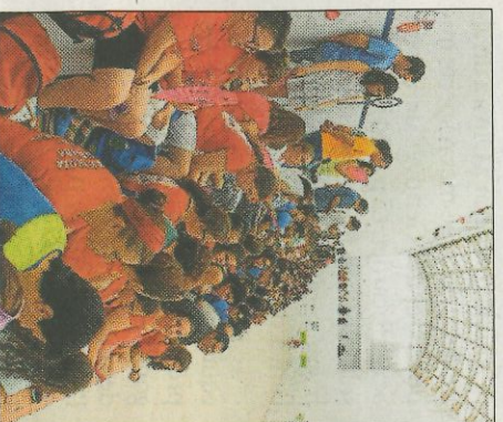
Trinquet d'Alcàsser.