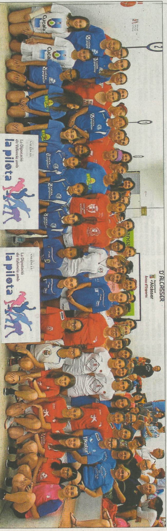
Les dones cada dia juguen més a raspall com demostra esta foto de família amb moltes de les jugadores. F.P.V.