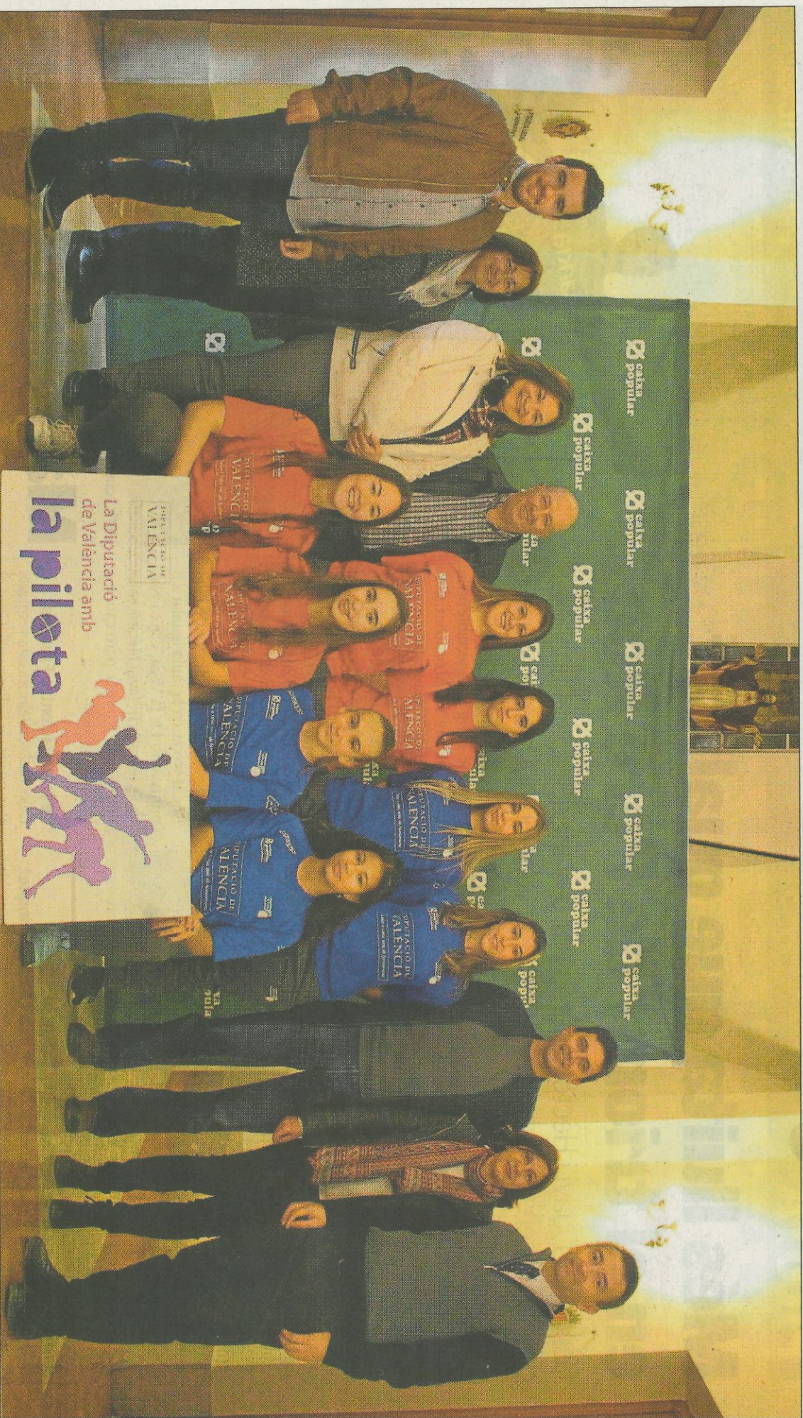
Presentació de les finals dels Circuits Femenins, amb jugadores i autoritats. F. P. V.