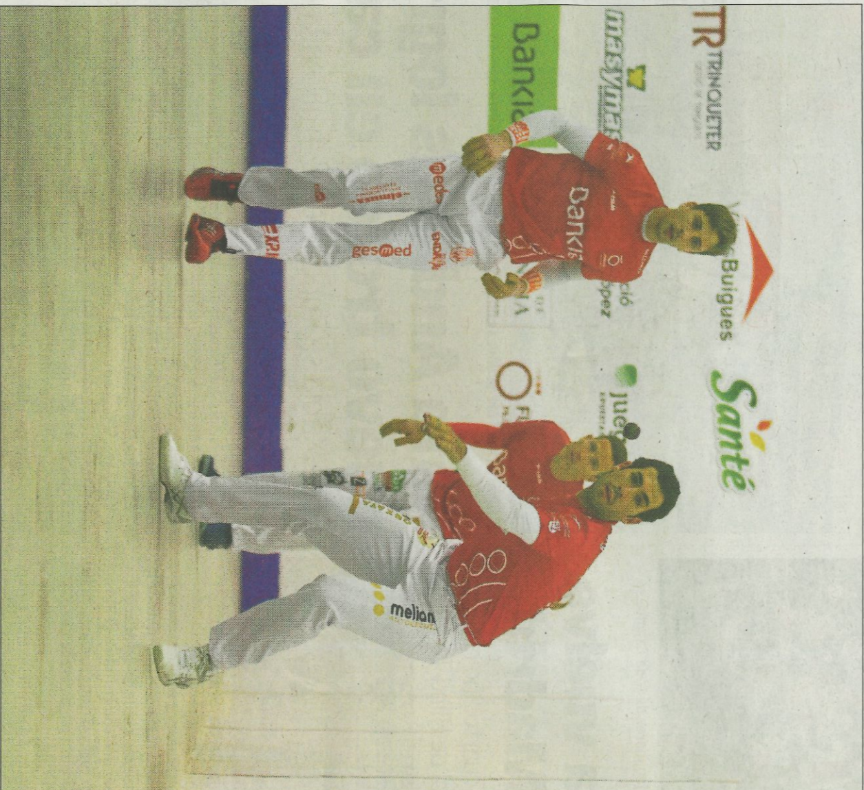
L'equip de València és líder en escala i corda, però empatat a punts amb el d'Almussafes. FUMPIVAL

El contrari els ocorre als de Vila-nueva de Castellón, Marrabí, Tonet IV i Néstor semblaven no arrancar en la Lliga, però en les últimes dues partides han demostrat que es pot comptar amb ells per a