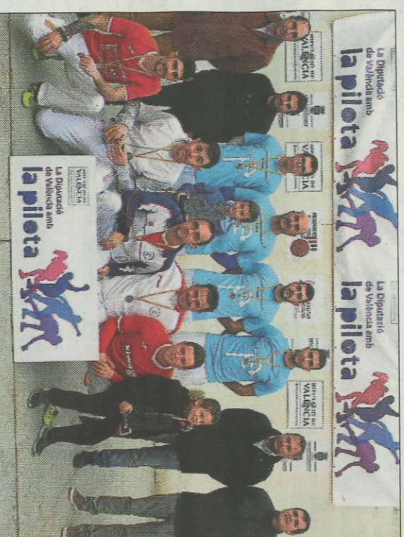
Montserrat va caure en la final juvenil. SP

El carrer de pilota d'Albalat dels Sorells va gaudir de dos finals boniques de galotxa amb els millors jugadors