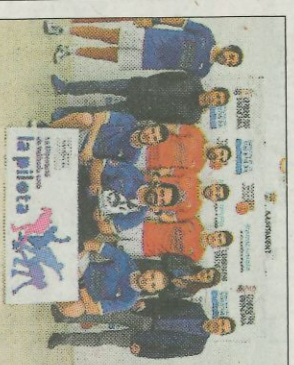
Final de la Supercopa de Raspall.