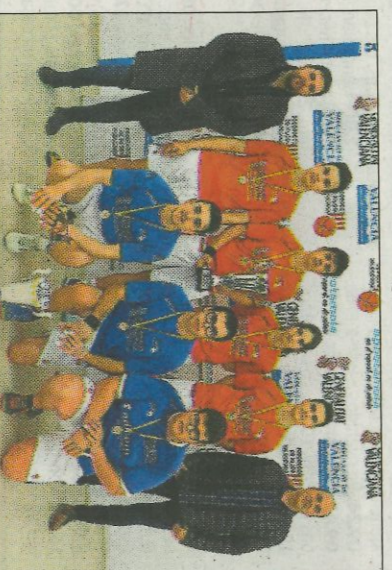
La Poble de Vallbona i Rafelbunyol amb els seus trofeus. SP

En la final s'avançaven els del Camp de Turia al inici delencontre, gracies al traure de Pasqual, ju-