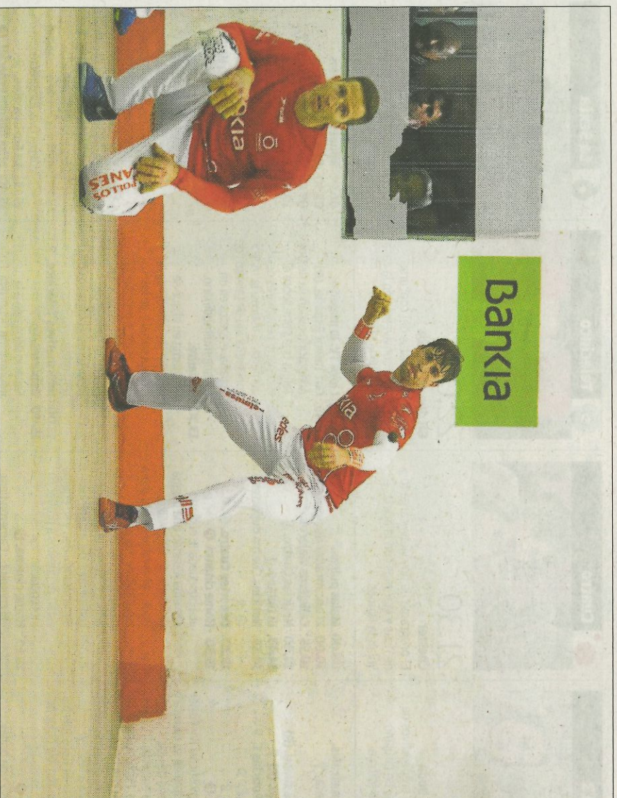
El equip que representa a la ciutat de Valencia s'ha posat al capdavant de la classificació. FUMPIVAL