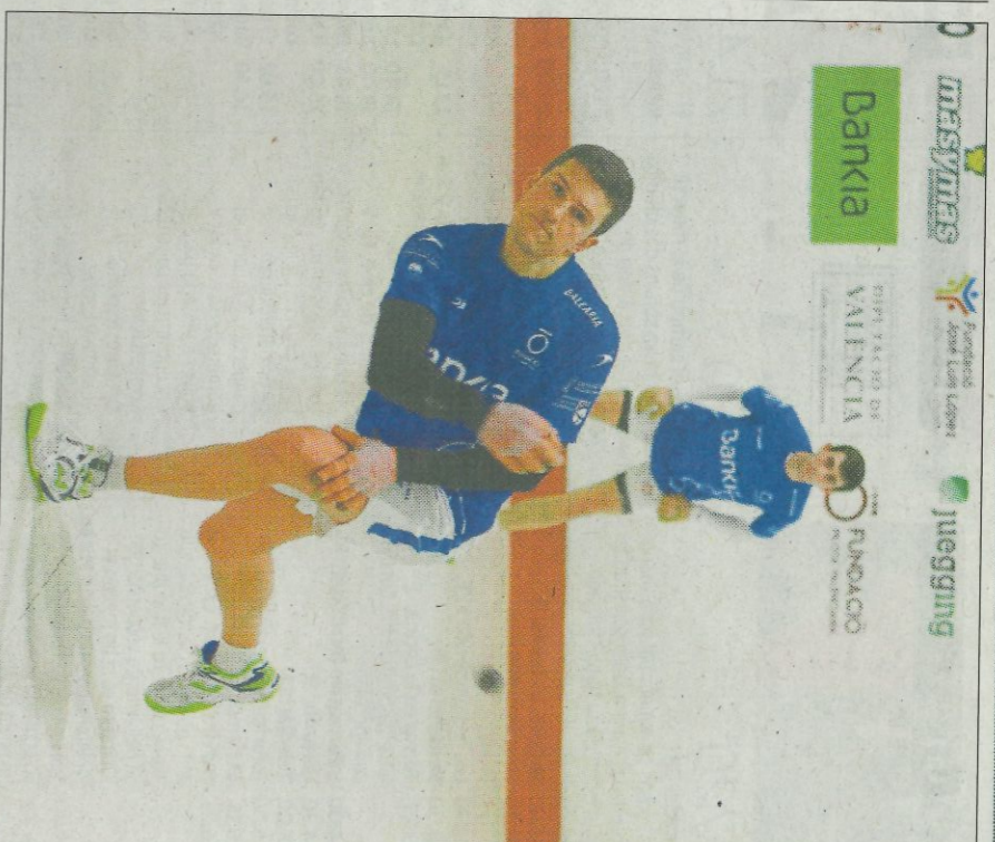
Gabi està rendint a gran nivell en la Liga Bankia i en la Liga 2. FUMPIVAL