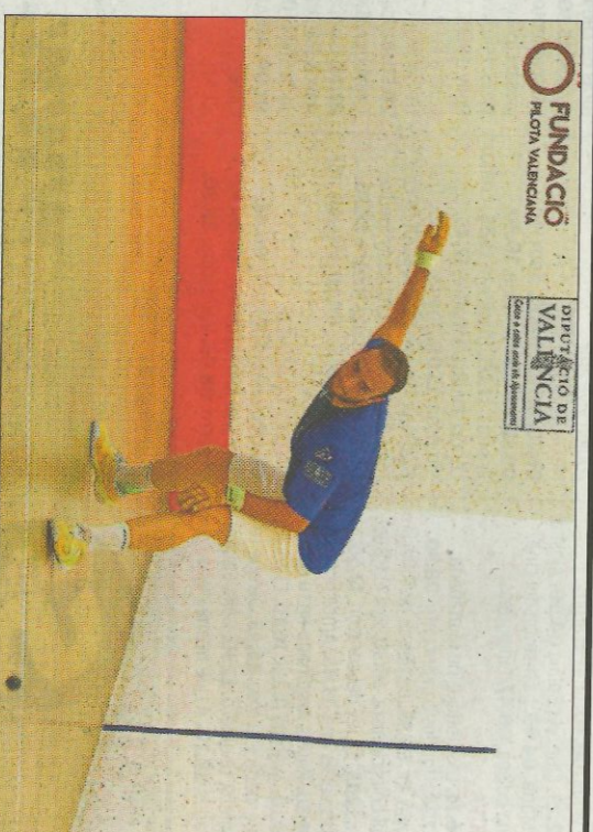
Punxa va caure en la primera jornada de la Liga 2 de raspall.

Amb el rest més experimentat d'esta competició i un punter que vol consolidar-se al mig, este equip ha sonat des del principi com un dels hipotètics favorits per a guanyar la Liga 2.