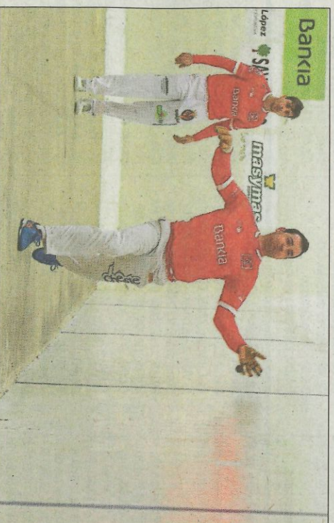
L'equip de València continua líder de la Liga d'escala i corda. FUNPIVAL

La partida va ser molt clara per als d'Oliva. Quan Montaner va estar al dau els jocs van durar un sospir a causa de la tretxa demolidora del rest d'Almiserà. I amb els blaus al rest, Bricca va ser qui va marcar la diferència. Pel que fa als derrotats, quan volgueren arrancar la confrontació ja estava decidida.