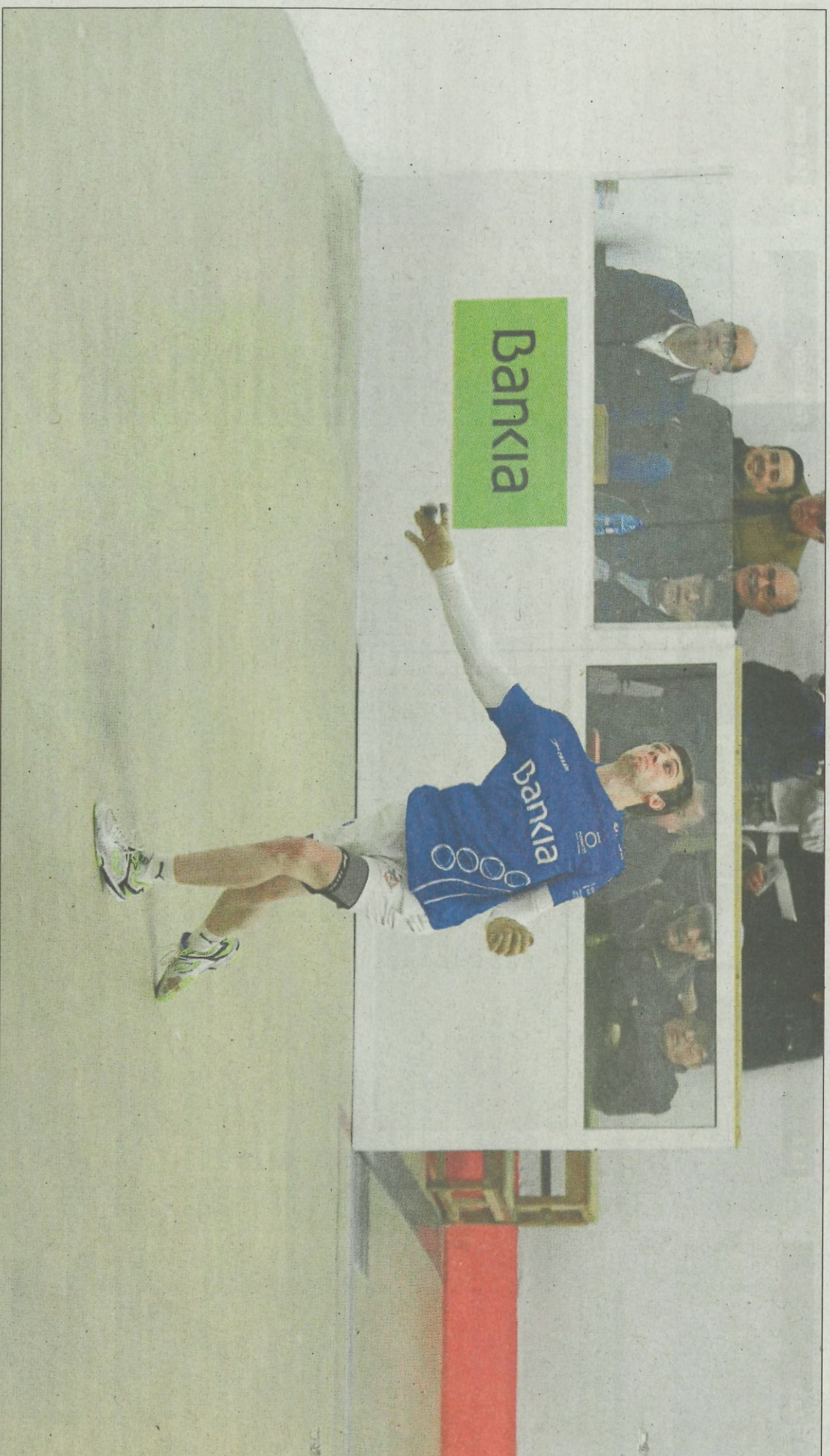
L'equip d'Oliva va sumar tots els jocs del dau a la carrera gràcies a la demolidora tretxa de Montaner.