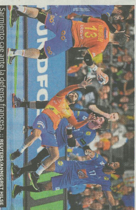
Sarmiento cae ante la defensa francesa.

VALENCIA. Puchol II, Raúl y Bueno progresan adecuadamente en el inicio de la Liga de escala i corda, donde cuentan sus partidas por victorias. Se sitúan en lo más alto de la clasificación tras vencer ayer en Pedreguer a Francés, Pere y Tomás II, que al menos sumaron su primer punto (60-50).