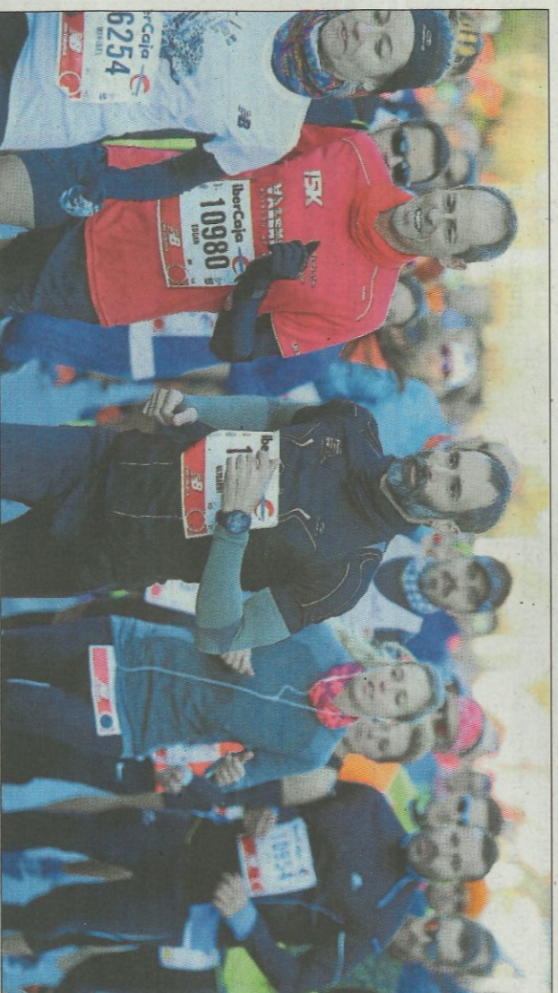
Un grupo de corredoras y corredores, durante la prueba.