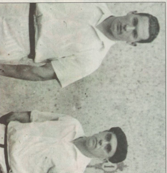
Gallastegui y Atano III antes de la final de 1948.

mejor corrida de toros de la época. Comenzó un reinado que se prolongaría hasta 1953 año en el que perdió el título por no presentarse a la final por desavenencias con la empresa organizadora. La muerte de estas grandes figuras nos recuerda tiempos gloriosos de la Pelota a Mano. Tiempos en los que no había colegio nuevo que no construyera su frontón, por decisión de un mi-