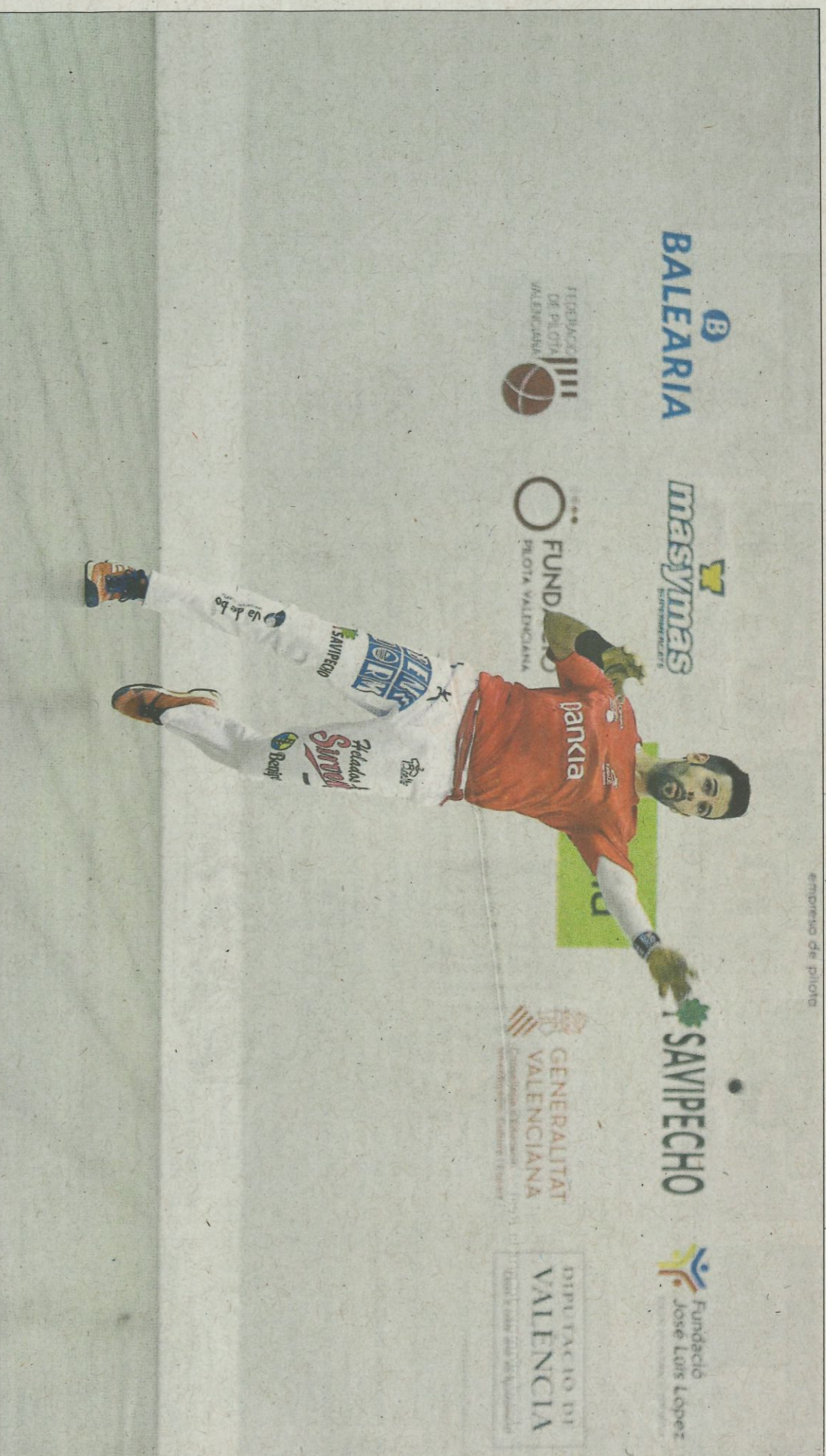
Pere Roc II ha estat campió de la Lliga d'escala i corda en les dues últimes temporades. FUNDACIÓ