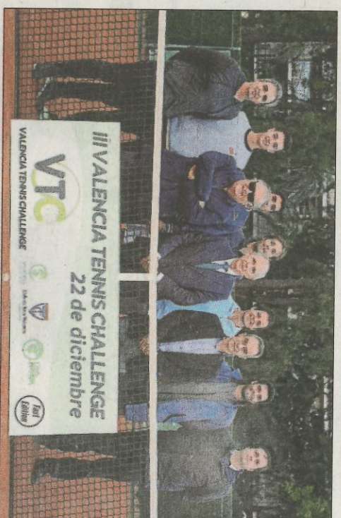
Los protagonistas del torneo, en el CT Valencia. VALÈNCIA

Además de jugarse por primera vez un cuadro cerrado de 16 jugadores, el torneo pasa de jugarse por equipos a ser torneo individual que adopta el formato fast edition con sets a cuatro juegos, «con partidos rápidos y dinámicos que resultan muy atractivos para los aficionados y los jugadores y que hacen del Valencia Tennis Challenge un torneo más abierto y divertido».