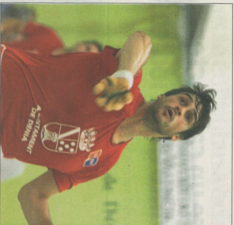
Genovés II ha sordejat nombrosos obstacles en la seua carrera. FPV