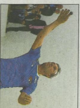
Sarasol II. FUMPIVAL

Ahans, a les 11,00 hores, es disputarà un enfrontament especial de