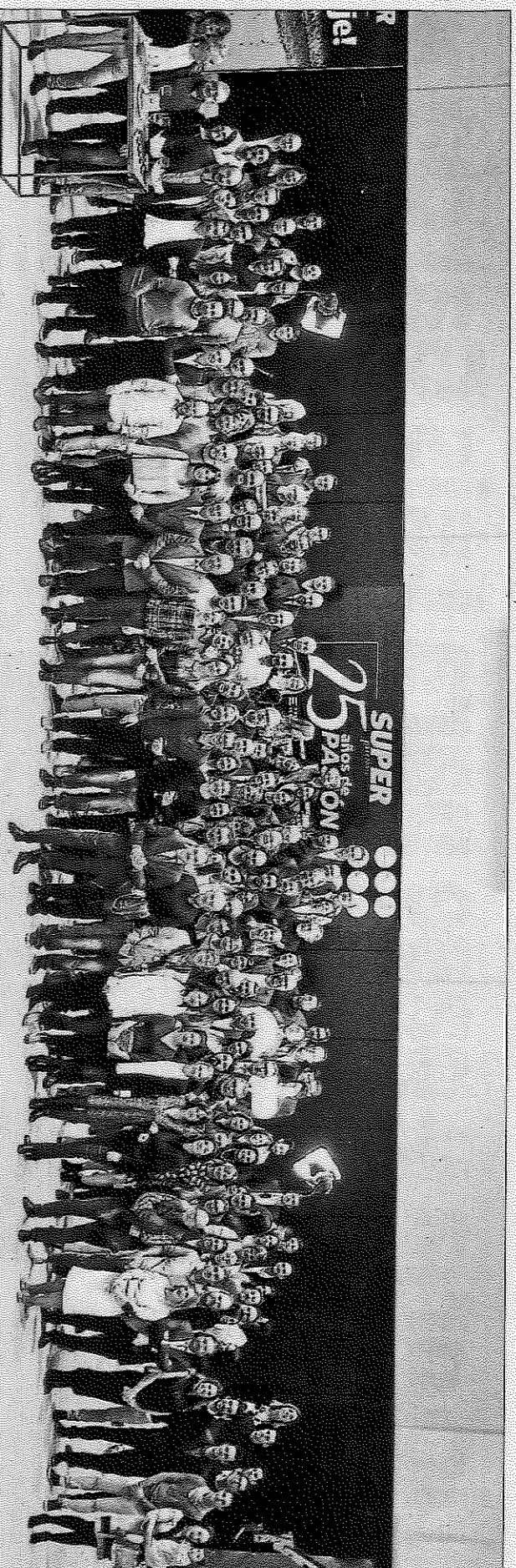
La quiebra del Basket del Valencia Basket reunió anoche a cientos de invitados para festejar un cuarto de siglo de Superdeporte en los kioscos. I. M. LÓPEZ