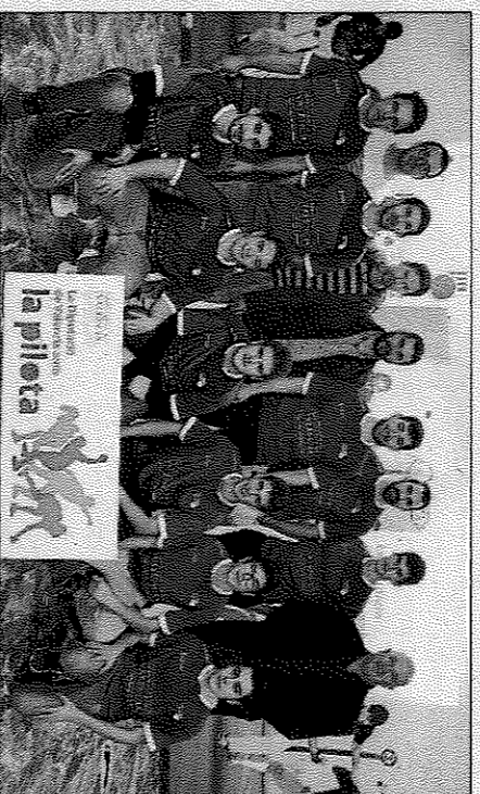
Gavarda i Xeraco jugaran diumenge les finals senior i juvenil.