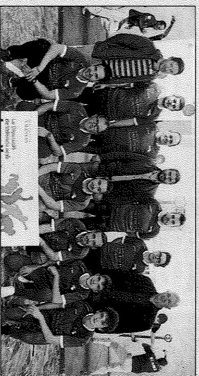
La vesprada del dissabte es jugaran en Genovés tres finals.

En el cas del trinquet de l'Alqueria, acabat de reformar i que viurà les seues primeres finals oficials de clubs, el dissabte a les 16 hores tindrà lloc la partida de primera femenina, amb l'Ajuntament de Beniparrell A i El Dau Rafelbunyol A com a protagonistes. A continuació aplegarà el torn de la final de la categoria de bronze, en la que les triques del Beniparrell D s'enfrontaran amb les de l'Oliva B. Per últim, a les 18 hores, la segona categoria tindrà de nou altre equip de Beniparrell, que en aquest cas es jugarà el títol amb el Borbotó B. La mateixa vesprada, al trinquet del Genovés, a les 15:30 hores es viurà la final masculina de quarta B entre Gavarda F i Favara B. La partida de tercera, amb l'Alcànte