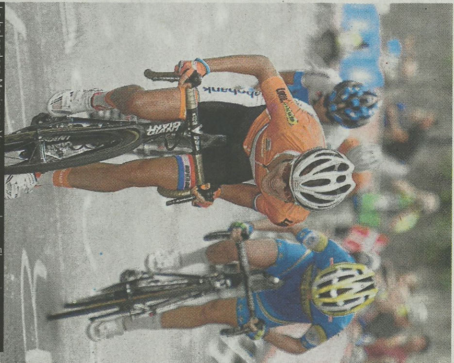
La holandesa Marianne Vos en una prueba en Florencia.