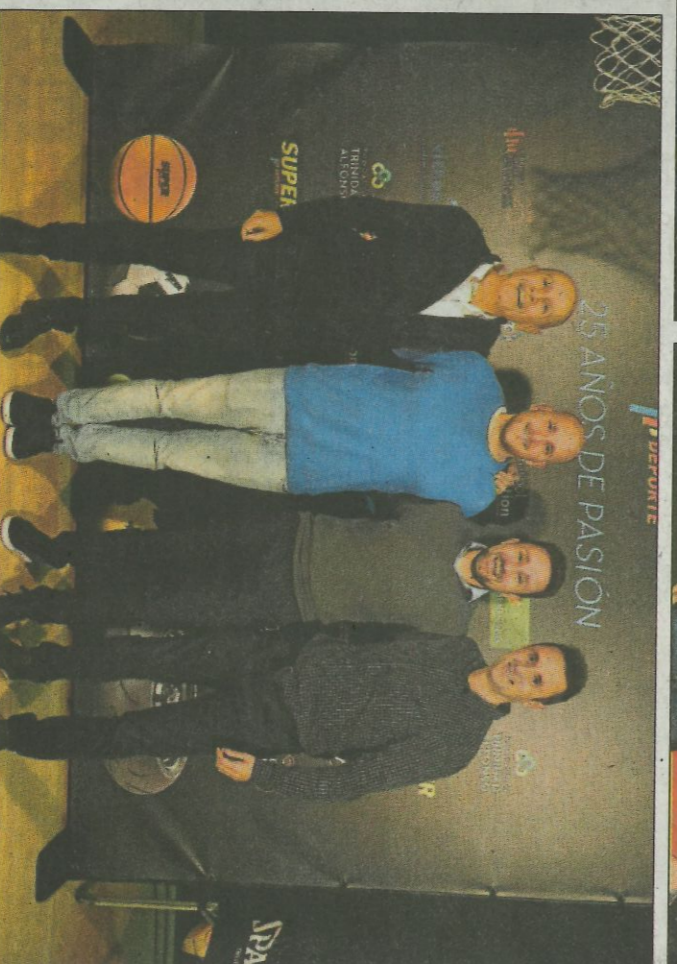
Como anfitrión de lujo, el Valencia Basket estuvo presente en la gala del 25 aniversario de Superdeporte con la totalidad de sus equipos masculinos y femeninos, así como con ambos cuerpos técnicos y la directiva taronja, en una velada en la que el ambiente de baloncesto estuvo siempre presente. I.H.Y.J.M.L.