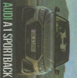
AUDI A1 SPORTBACK

COCHES SELECCIONADOS COMO CANDIDATOS DE LA VOTACIÓN EN LA