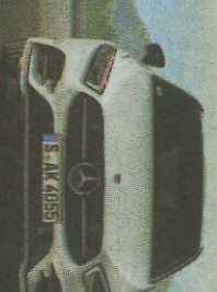
MERCEDES-BENZ CLASE A