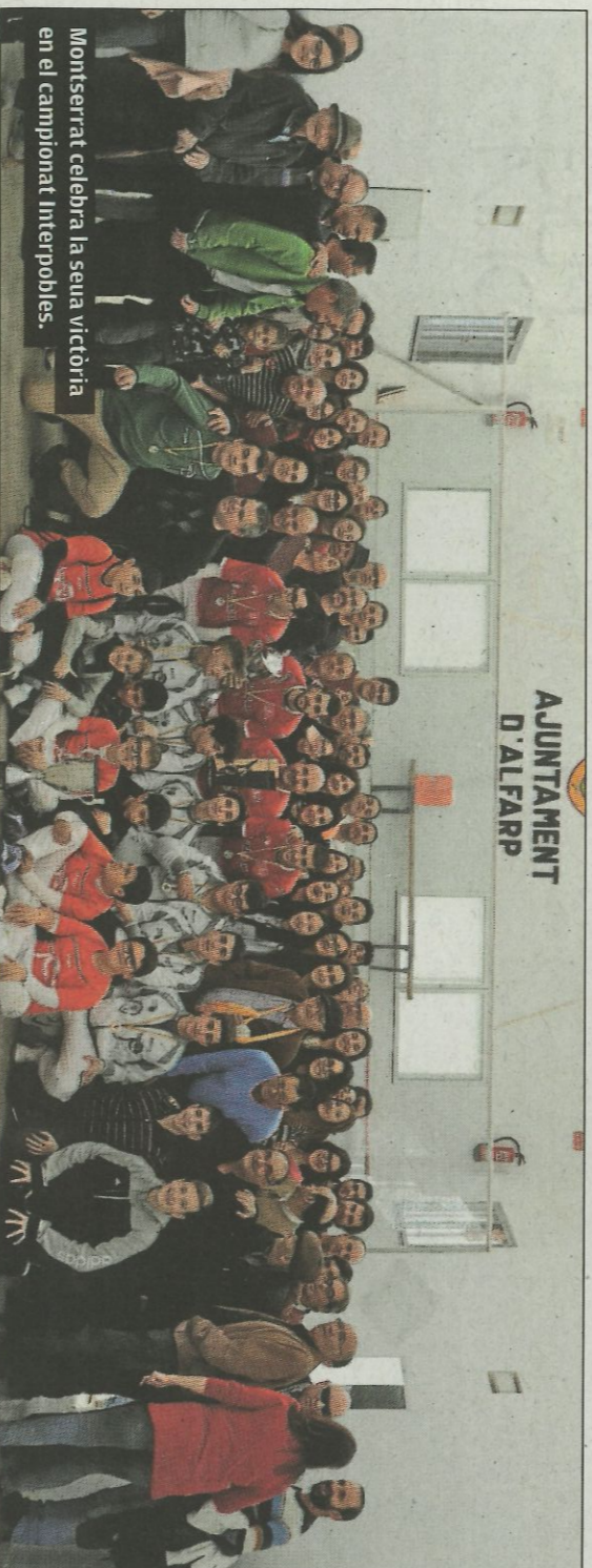
Montserrat celebra la seua victòria en el campionat Interpobles.

triomf en l'Interpobles. En els pobles es porta el compte dels títols conquistats. I si no, allí estan les vitrines repletes per a recrear fòtos i instantis d'una densa història. Hem vist també una emocionant final femenina de les dones que s'atrevixen amb una modalitat que requereix d'alta qualitat tècnica combinada amb la força física. Una final entre dos clubs pioners com els de Borbotó i de Godella que saben de la importància de la política d'igualtat en este esport. Els clubs que fomenten la presència femenina tindran garantit el seu futur. Junt amb dones pilotaris sorgiran en els clubs dirigits amb els valors de la perseverança i del treball organitzat. Els propis federatius i els patrocinadors estaven sorpresos de la capacitat de convocarària que arossegava l'Interpobles. Tot ha sigut bell i reconfortant en un cap de setmana que tindrà continuïtat en altres grans competicions com La Bola, a la modalitat de Llargues. Vatrietar que fa gran al loc de Pilota.