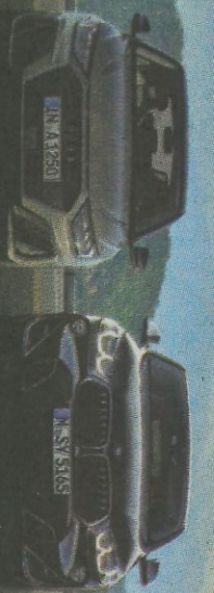
AUDI A1 SPORTBACK

COCHES SELECCIONADOS COMO CANDIDATOS DE LA VOTACIÓN FINAL