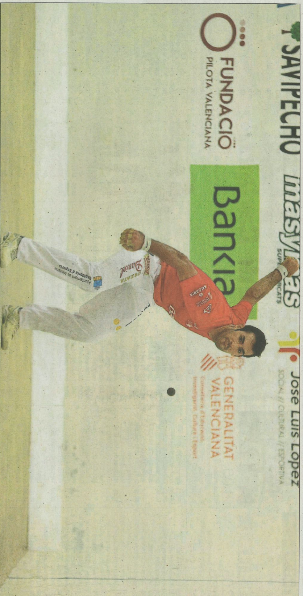
A Bueno li va caure la pilota de la galeria quan tenia val per a acabar i passar a la final de l'Individual d'escala i corda. FUMPIVAL