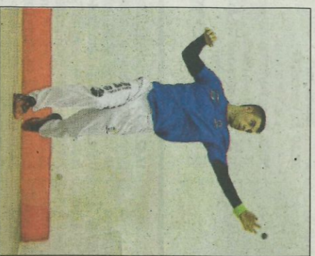
De la Vega d'Almussafes.

Així de fàcil. La resposta dels dos, més que ràpida. «No m'ho vaig pensar molt. Després de quedar-me a un pas de la final estava espe-