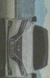
MERCEDES-BENZ CLASE A