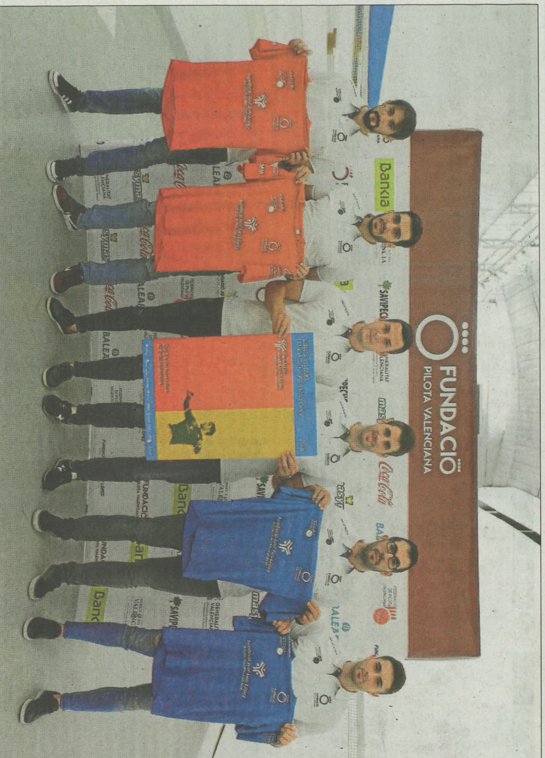
Moment de la presentació del III Trofeu Mixt Fundació José Luis López, ahir al trinquet Pelayo.