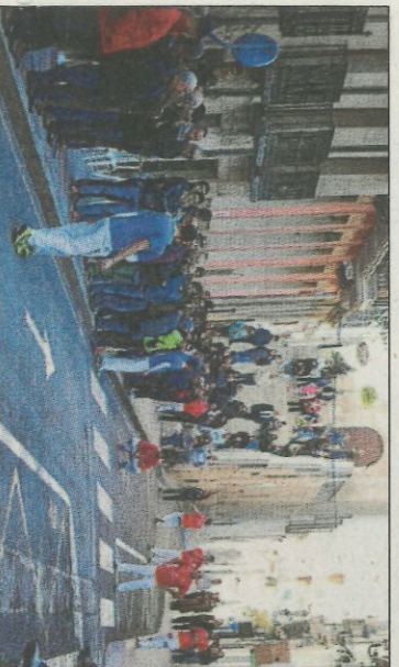
Un instant de la final de 2016 a Alacant.