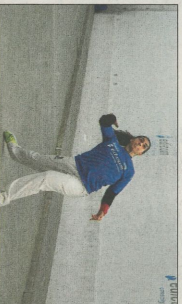
Borbotó continua jugant finals femenines. FPV

El III Circuit del Llargues que patrocina la multinacional La Bolata Importa, S.L., arriba este diumenge a Mutxamel. El calendari de partides per a Mutxamel serà este: A les 10 arrencarà la jornada amb la partida entre Sella i Orba. Benidorm i El Campello protagonitzaran la partida de les 12.00 hores, mentre que per la vesprada, a les 15.00 hores tancaran la jornada els equips de Parcent i Muria. És l'únic El Campello, amb sis punts i segon, Benidorm amb 5. En 3a posició empataen els equips de Muria i de Sella.