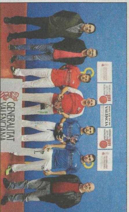
Els quatre protagonistes de les primeres finals d'Entre Setmana.

gadors van ser presentats a l'acte i a més se'ls va obsequiar amb un lot de material per haver aconseguit arribar a estes finals tan desitjades. Després de la presentació, els jugadors de primera es dirigien cap al frontó per a fer la ja tradicional tria de pilotes amb les que el prò-