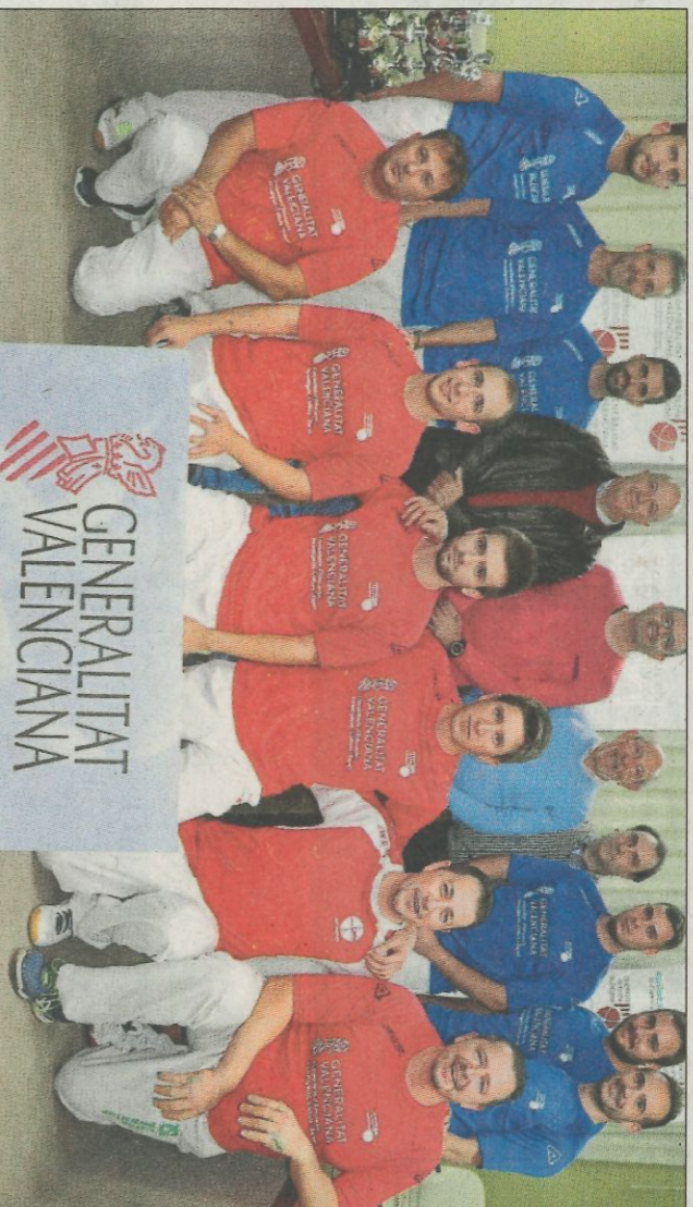
Presentació de tots els finalistes a l'Ajuntament d'Almussafes.