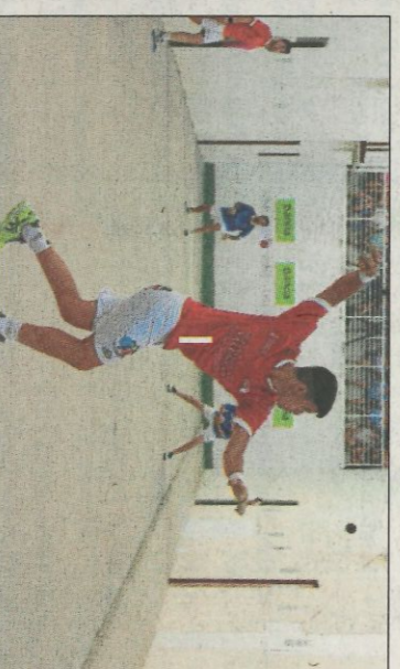
Xeraco intentarà jugar la seua segon final de l'any.

La 32ª edició de l'Interpobles de Galotxa-Edicom, presentatà el pròxim dimarts 27 de novembre, a les 20:30 hores, les nombroses finals de la competició. L'acte tindrà lloc en la seu d'Edicom del Parc Tecnològic de Paterna. En primera de carrer jugarà Beniparrell i el guanyador de la semifinal entre Montserrat i Quart de les Valls, mentre que en trinquet els finalistes seran Alfara de la Baronia i Alfara del Patriarca. Borbotó i Godella són els finalistes en categoria A femenina.