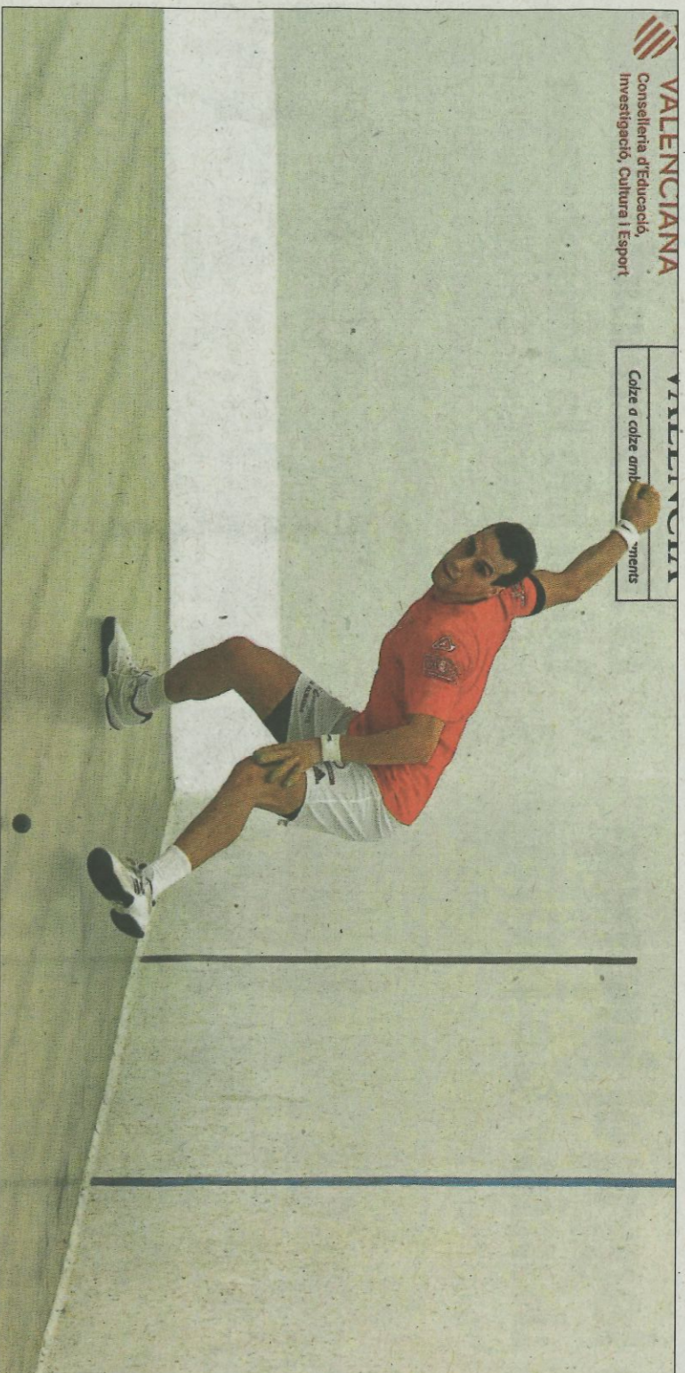
Moltó obri hui el Trofeu Mancomunitat de la Costera-Canal al trinquet de Genovés.

VALENCIANA Conselleria d'Educació, Investigació, Cultura i Esport