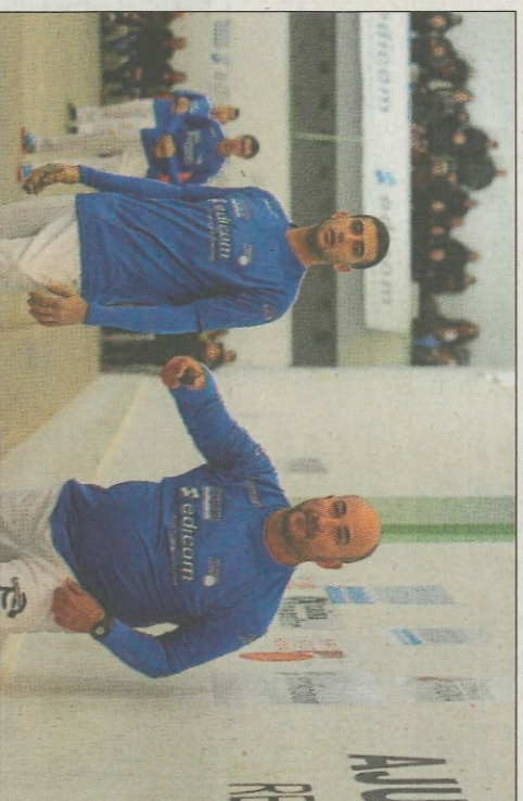
Monserrat continua defensant el títol guanyat en el 2017.

a 40 deixa l'eliminària oberta per a la partida de tornada que es jugarà en la pedania de Valencia, que es jugarà demà a les 16 hores.