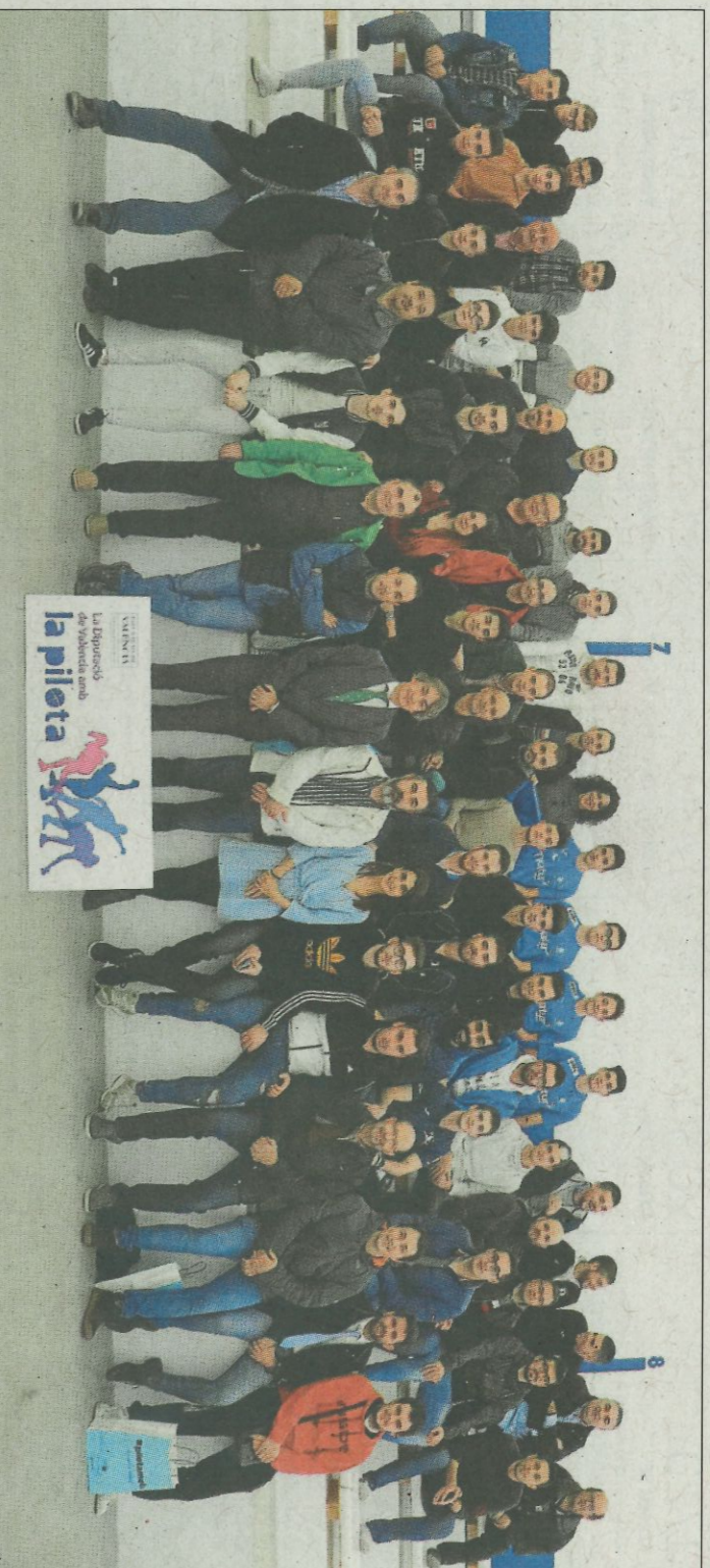
ran assistència en Pelayo dels clubs participants a la presentació de l'AON 2018-2019. sd