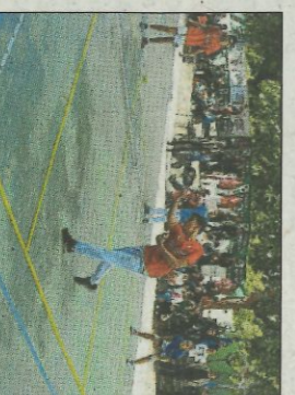
One Wall. sd

■ El poliesportiu de Massamagrell serà la seu de les fases finals dels XXXVII Jocs Esportius de la Comunitat Valenciana de One Wall individual de les categories benjamí, aleví, infantil i cadet, a partir de les 9:00 hores. Si plou es jugarà a Tavernes Blanques, encara que no més jugarien els jugadors benjamins i cadets, a partir de les 11:30 hores. Estan classificats per a disputar aquesta ronda 111 esportistes i 44 escoles d'Alacant, Castelló i València. El cap de setmana passar van destacar els pilotaris de Moixent,