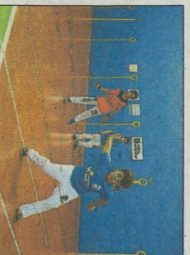
Jocs Esportius. sd

■ Els xiquets i xiquetes de les escoles de pilota valenciana estaran pendent de les pluges per veure si poden jugar les seues partides dels XXXVII Jocs Esportius de la Comunitat Valenciana de frontó per parelles. Aquest cap de setmana es disputa la 2ª jornada de competició d'aquesta modalitat en 11 localitats: Oliva, Moixent, Montserrat, Pobla Vallbona, Massamagrell, Massalfassar, Tavernes Blanques, Onda, Almàsora, Castelló i Peter. En total quasi 400 equips procedents de 70 escoles. Si la pluja persisteix no-