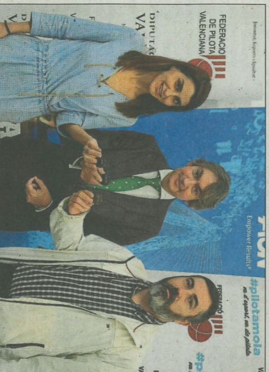
L'ajuntament de la Pobla de Vallbona i l'empresa AON col·laboren.