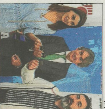
La Pobla i AON recolcen la FPV.

Una vegada jugades les primeres partides de semifinals de la màxima categoria en trinquet l'Al-