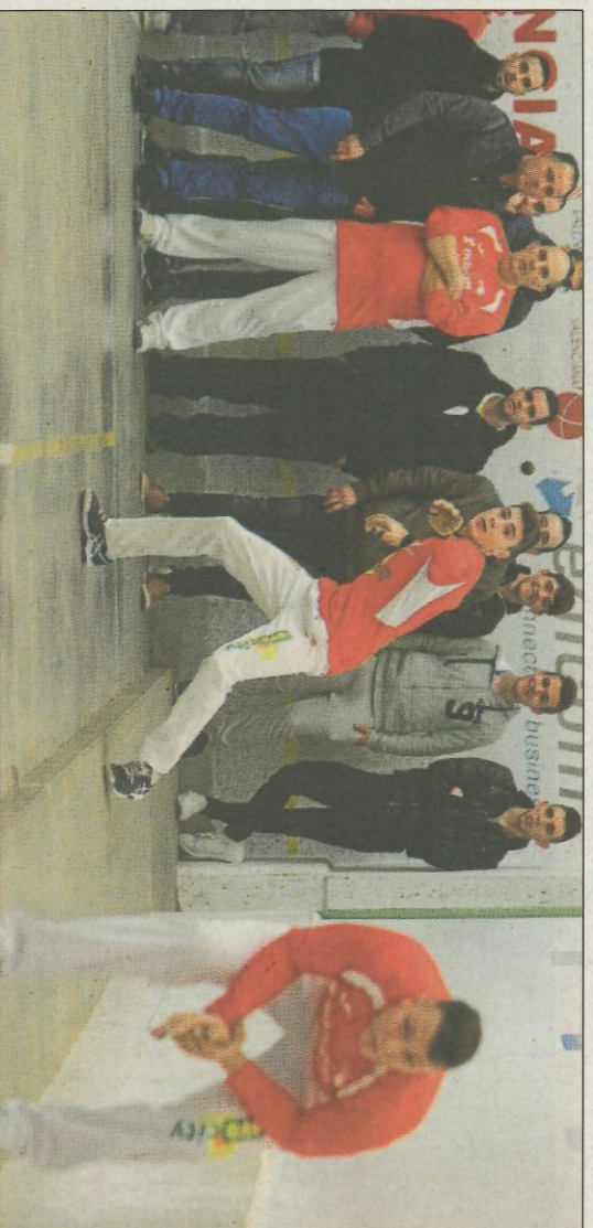
Marquesat afronta una difícil visita al carrer de Beniparrell amb la final del torneig com a motivació. FPV

Respecte a la categoria juvenil, els joves jugadors de l'escola de Monserrat també apunten a la final, ja que aconseguiren un 20 a 50 en el seu desplaçament a Beniparrell, i a que jugaran la tornada aquest cap de setmana al seu carrer. L'altra semifinal està més en l'aire, ja que el Marquesat va guanyar en casa al Borbotó, però el 50