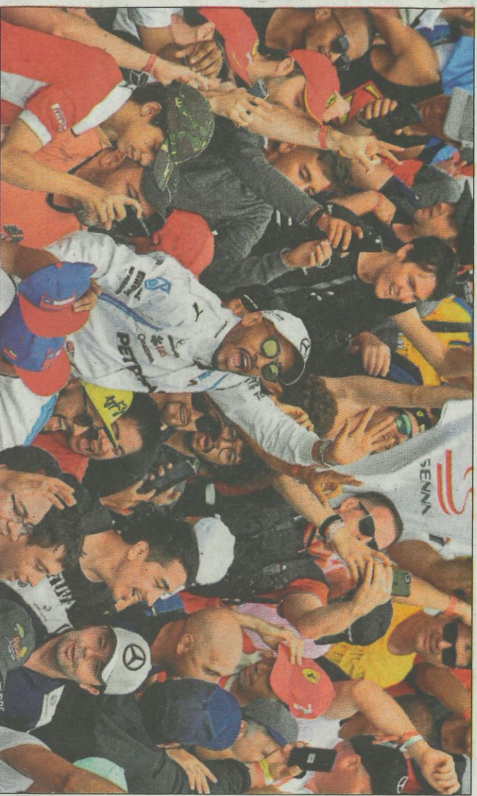
Hamilton celebra su victoria en Brasil, ayer.