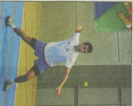
Saelles de Bellreguard, que va ser el millor i podio juvenil.