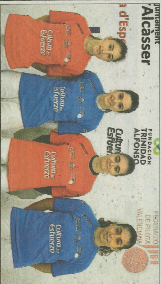
Finalistes del sub-18 -esquerra- i del sub-23 -dreta- dels individuals de tecnificació de raspall.