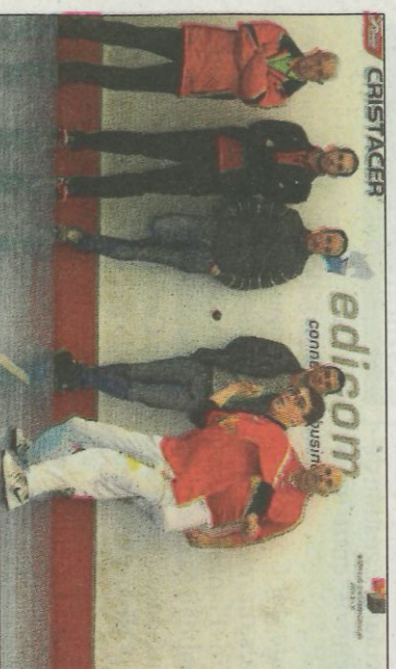
Comença la part més emocionant del Torneig Edicom.