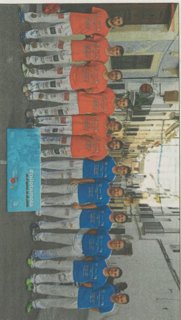
Els equips de Sella (roig) i de Castell de Castells (blau) reediten la final de 2017.

► Castell de Castells i Sella reediten la final de primera categoria de l'any passat