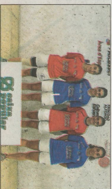
Jugadores de les finals individuals sub-23. FPV

■ El trinquet Pelayo de València, la catedral de l'escala i corda, acollirà de nou, el pròxim dimecres 14 de novembre, a les 20 hores, la presentació del 21é Campionat Autonomí d'Escala i Corda, gran premi AON. Més de trenta clubs, que presenten un total de 75 equips a les cinc categories del torneig, entraran en competició a finals de novembre, disputant el campionat fins a mitjans de març, quan es jugaran les finals en el terrer del trinquet de la Pobla de Vallbona.