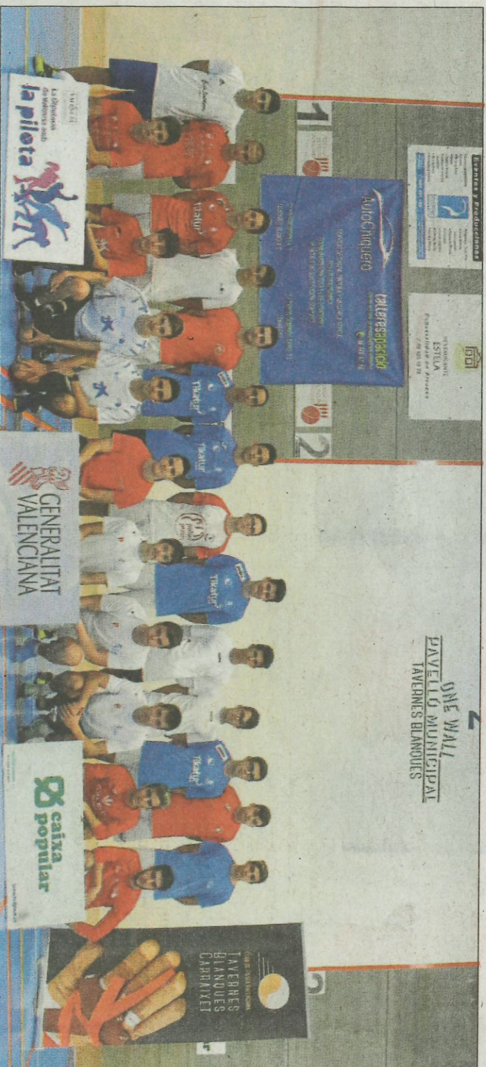
Finalistes categoria juvenil One Wall individual. SD

Una vegada més el CPV Carriaxet Tavernes Blanques cuida tots els detalls de l'organització de la fase final junt a la Federació de Pilota Valenciana demostrant que són un dels clubs més actius i que més promocionen el One Wall.