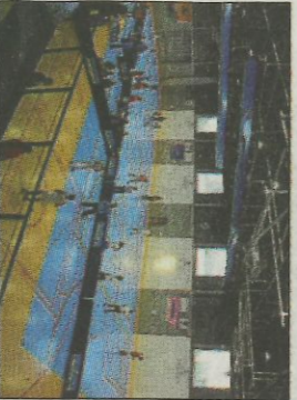
Tavernes Blanques, gran escenari.

En la fase final dels XXXVIII Jocs Esportius de la Comunitat Valenciana de One Wall parelles s'han classificat 108 equips en les cinc categories de competició amb la presència de 40 escoles de les tres províncies on estaran representades les escoles de: Beniarbeig-El Verger, Borriol, Llíria, Oliva, Moixent, Quart de Poblet, Massamagrell, Sella-Relleu, Agost, Oliva CEIP Santa Anna, Faura, Almassora, Dénia, València CEIP Tomás de Montañana,