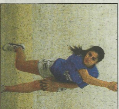
Mar de Bicornb. SD