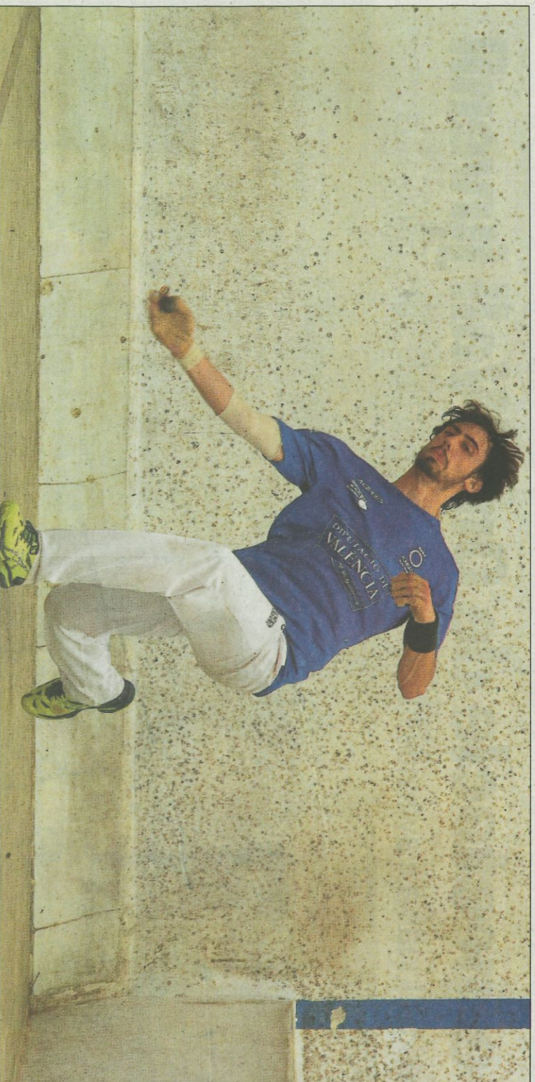
A Giner li agrada especialment que el desafiament es jogue al trinquet de Dénia, que requereix molta potència en la pegada. FUMIVAL