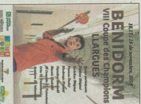
Cartell de la Champions.

El xaval estudia la carrera de fisioterapeuta en la Universitat d'Elx i distruia amb la pilota, en la seua condició de líder indiscutible de l'equip de Benidorm, campió en les dos últimes edicions de la Lliga de Llagues de la Diputació d'Alacant. Distruia a pesar de sentir en la seua ànima la marginació i l'oblit en el circuit de partides de festes. Què més ha de demostrar l'equip de Benidorm? També va ser campió individual sub-18 en Escala i Corda i en la modalitat d'One Wall és dels punters. Té geni de campió. A favor seu, una de les èpiques re-