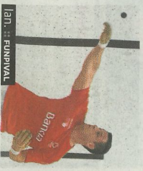
Jan. ■ FUNPIVAL