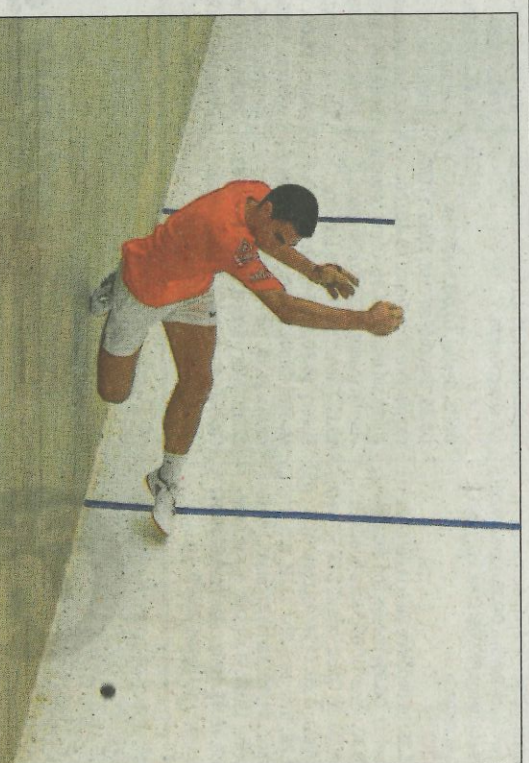
Tonet IV en el passat Trofeu 600 Anys Generalitat. FUMPIVAL

Com que el trinquet de Piles obri hui, el d'Oliva finalment no farà partides. El divendres serà a la inversa per a tornar el favor. Després d'esta vesprada quedaran quatre sessions més en el Trofeu Mixt Savipecho, que seran dobles. És a dir, huit partides.