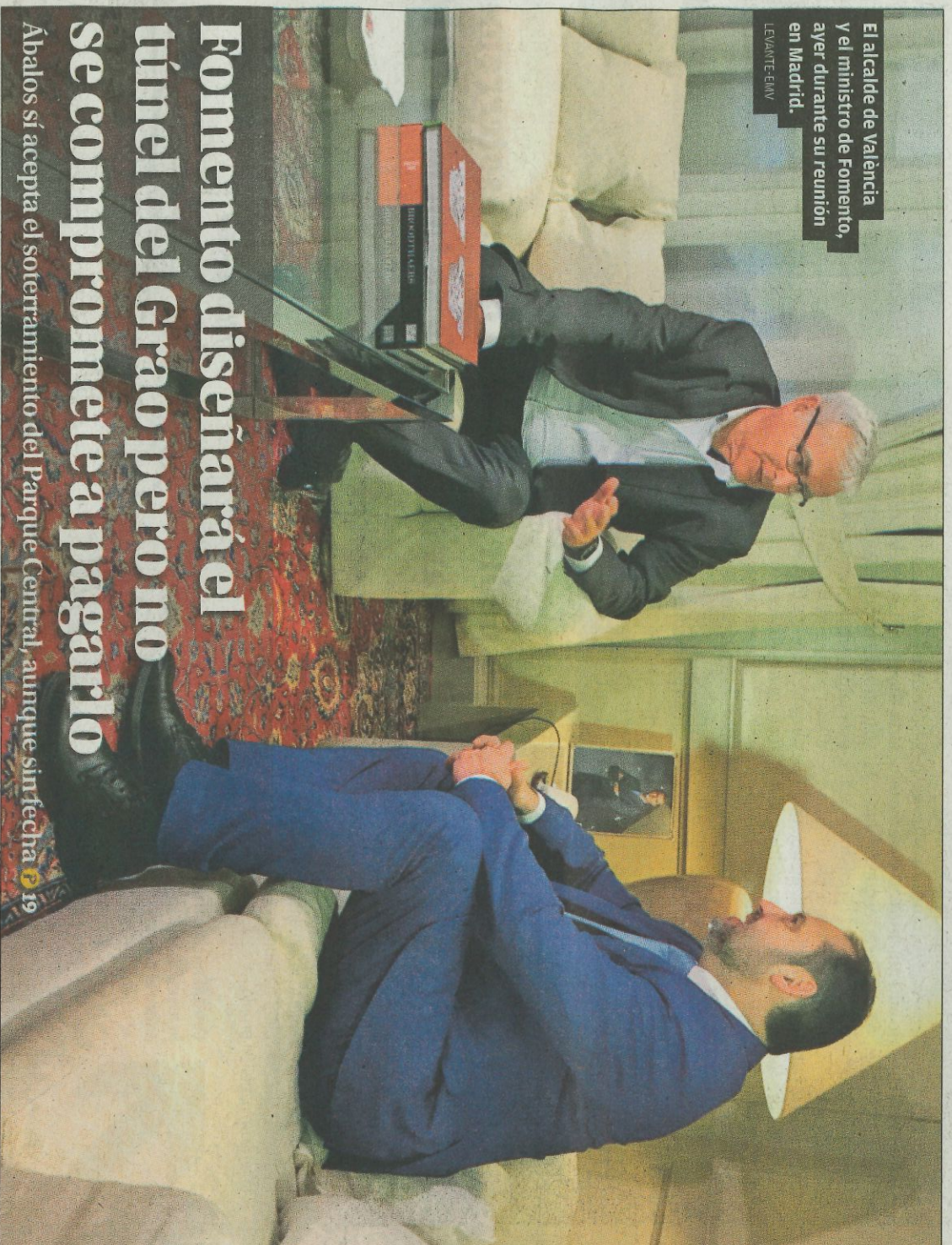
El alcalde de Valencia y el ministro de Fomento, ayer durante su reunión en Madrid.

► Médicos, enfermeras y celadores boicotearon ayer las intervenciones vespertinas 6