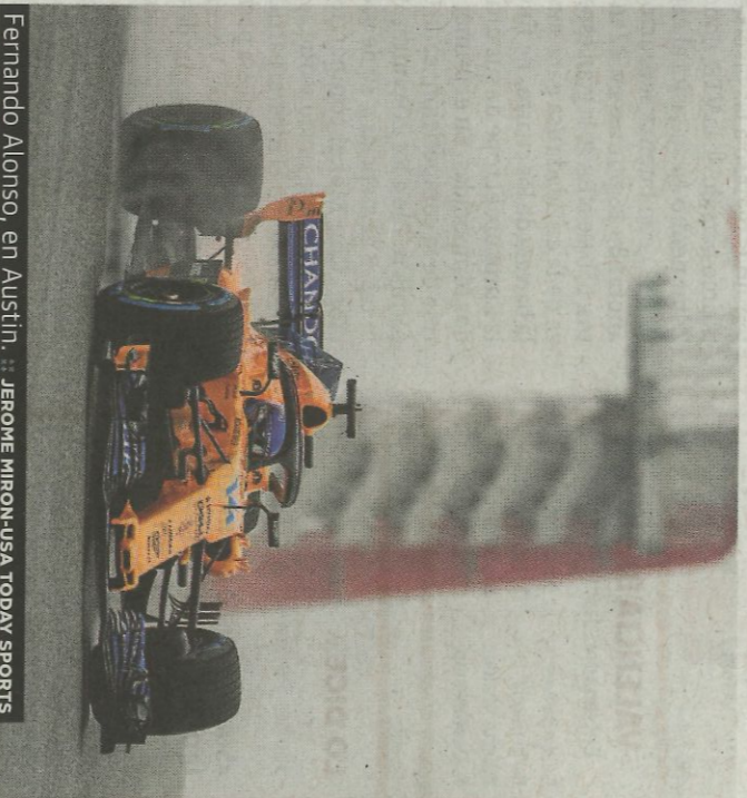
Fernando Alonso, en Austin.

A esos no se les exige que estén a un gran nivel. Sólo que no estorben a los profesionales. El problema en la Fórmula 1 es que, sin llegar a ese grado de amateurismo, están llegando al teórico pináculo del automovilismo corredores que aún tienen la sangre demasiado caliente como para refrenar sus impulsos. De entre, hay uno que está brillando y que es capaz de lo peor y de lo mejor: Max Verstappen.