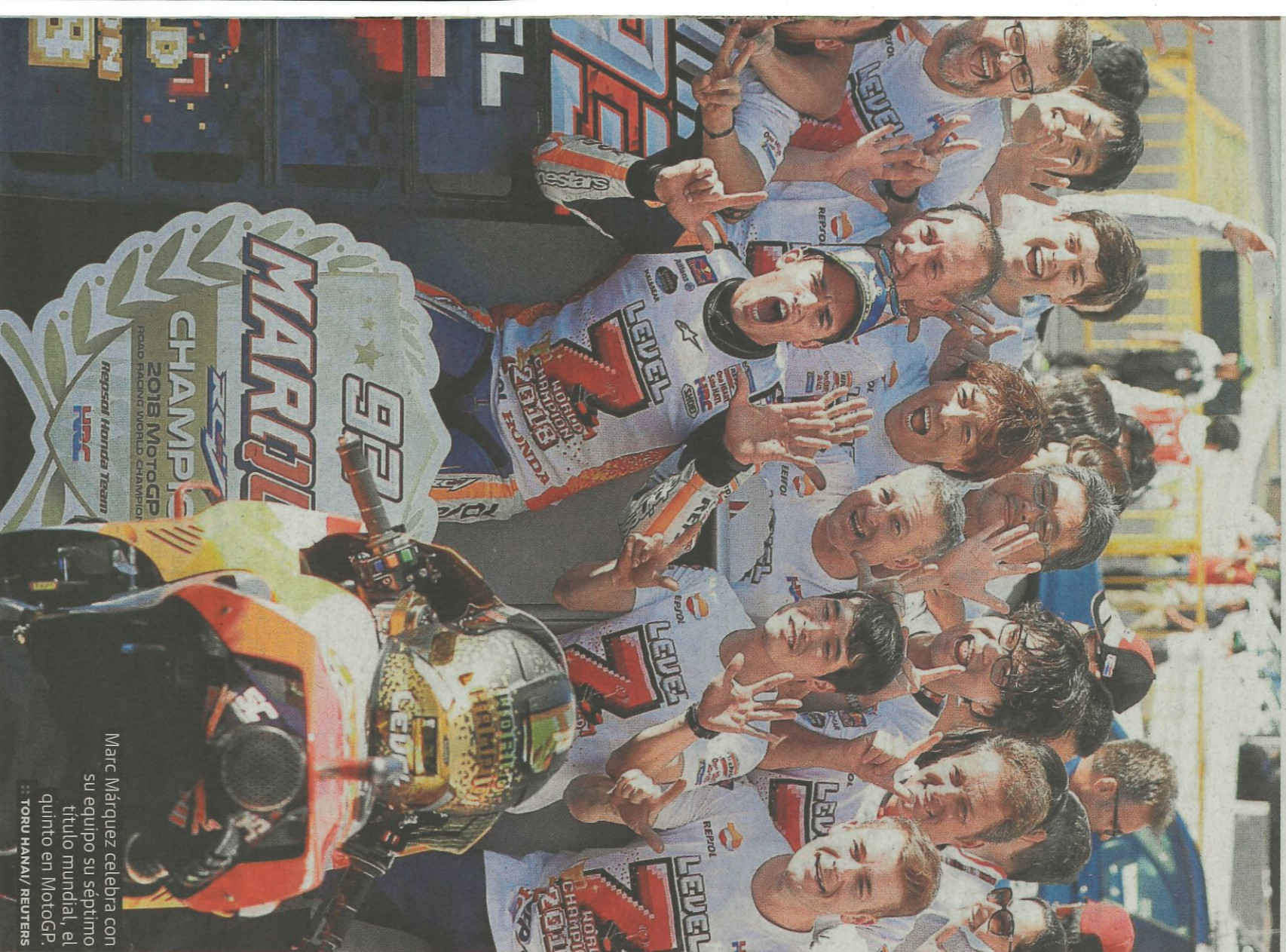
Marc Márquez celebra con su equipo su séptimo título mundial, el quinto en MotoGP.