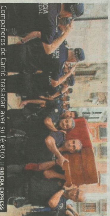
Compañeros de Carrió trasladan ayer su féretro.