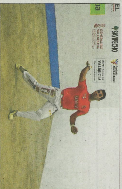
Bueno va ser molt superior a Nacho en la segona meitat. FUMPIVAL

Puchol II aconseguí la victòria per 60 a 35, uns números que diuen menys del que realment offerren els dos aspirants, tot un privilegi per a la vista del públic. El guanyador s'enfrontarà a Pere el pròxim diuen des en la primera semifinal del