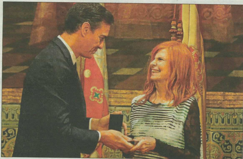
La exministra de Cultura, Carmen Alborch, recibe la Alta Distinción de manos del presidente Sánchez.

Alborch también destacó que el premio es un reconocimiento a la lucha de la mujer: «Nadie me lo ha explicado así, pero yo así lo he interpretado, como un reconocimiento a todas esas luchas que se han encaminado y se han encarrilado en nuestro itinerario vital que vas acumulando a lo largo de los tiempos». La exministra añadió después a los me-