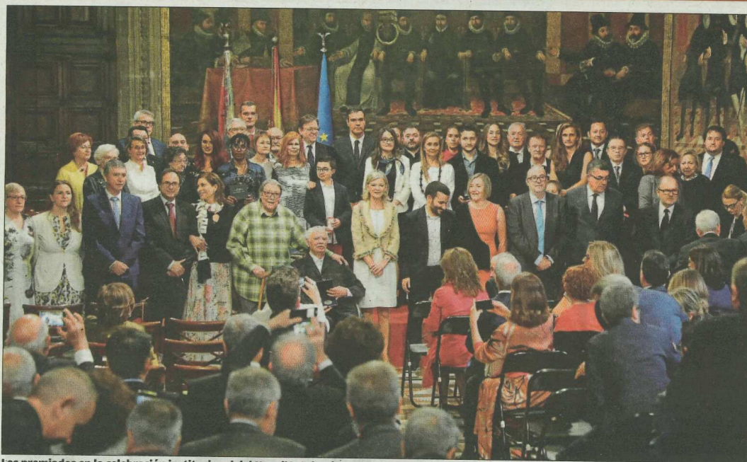
Los premiados en la celebración institucional del Nou d'Octubre junto a los presidentes del Gobierno y de la Generalitat. F. BUSTAMANTE