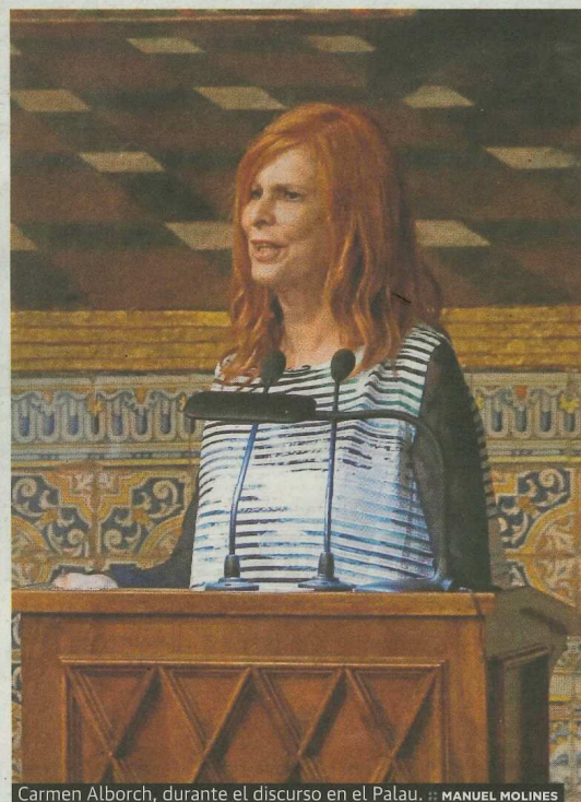
Carmen Alborch, durante el discurso en el Palau.

La exministra asegura que a los premiados con los galardones de la Generalitat les une la motivación «de hacer un mundo mejor»