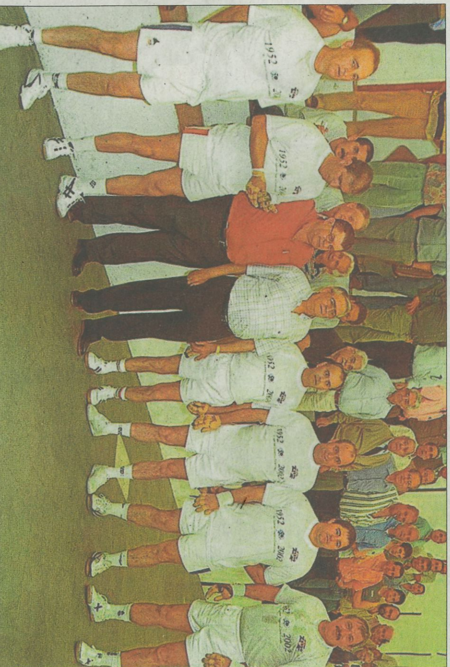
Partida de celebració del 50 aniversari del trinquet El Zurdo. PACO DURÀ

es jugava en aquell temps a les modalitats d'escala i corda i raspall. I no cal dir que per allí passaven totes les millors figures de les dos modalitats. Noms mítics, com els de Julieta, Rovellat, Xato de Carlet, Xato de Museros, Ferreret, Ruiz, Gat I, Soro, Llopis, Machi, Eusebio, Genovés, Fredi, etc. així, com els millors del raspall, Malonda I, Malonda II, Sanchis, Ciscar, Miquel de Costa, Crespo, Mena, Cos-