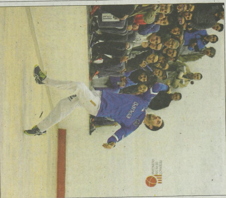
Nacho és el segon classificat per als quarts de final. FUMPIVAL

Punxa ve de guanyar pel mateix resultat a Miravalles, que va començar bé i va acabar minvat de facultats per unes molesties. Tot i això, el pilotari de Piles va ser superior i just vencedor.