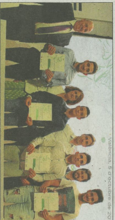
Quatre dels alumnes amb els diplomes pel bon rendiment esportiu.