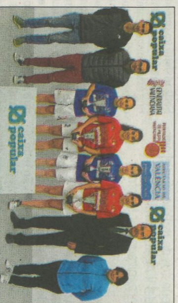
Finalistes del Individual sub-23 de raspall. FPV

■ El 14 d'octubre serà quan es jugue la 5.ª Supercopa de Raspalla a Bicorp, mentre que la corresponent a escalà i corda tin- drà lloc el mateix dia en el trinquet de Pelayo. Els protagonistes de la partida a l'alt seran Quart de les Valls i Fotós, que jugaran a les 11 hores. Dues partides a Bicorp. La masculina a les 10:30 hores, tindrà com a rivals al Rafelbunyol, amb Albertó, Moro i Pasqual, i al equip local Bicorp. A les 12, i televisada en directe, Beniparrell i Bicorp jugaran la final femenina.