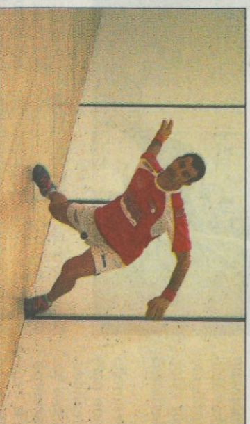
Moro tornarà a jugar per Rafelbunyol. FPV

■ El Trofeu President de la Generalitat Valenciana de Frontó Individual encara les dues últimes jornades, en la màxima categoria, en la que pareix que els primers de grup, si no hi ha sorpresa ma- júsca, seran Alejandro de Paterna al grup A i Adrián de Quart al B. S'anuncien tres partides. Enriqué de Museros i Vicent de Mon- cofi jugaran dijous. Les altres dues partides seran per al dissabte, a les 18 hores, a Quart, jugaran els dos Adrián, mentre que a les 18:30 es disputarà el Pasqual - Alejandro a la Pobla de Vallbona.