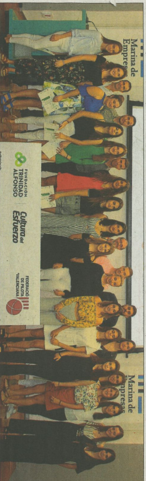
Les alumnes de l'escola de Tecnificació de la Federació de Pilota Valenciana. F.P.V.