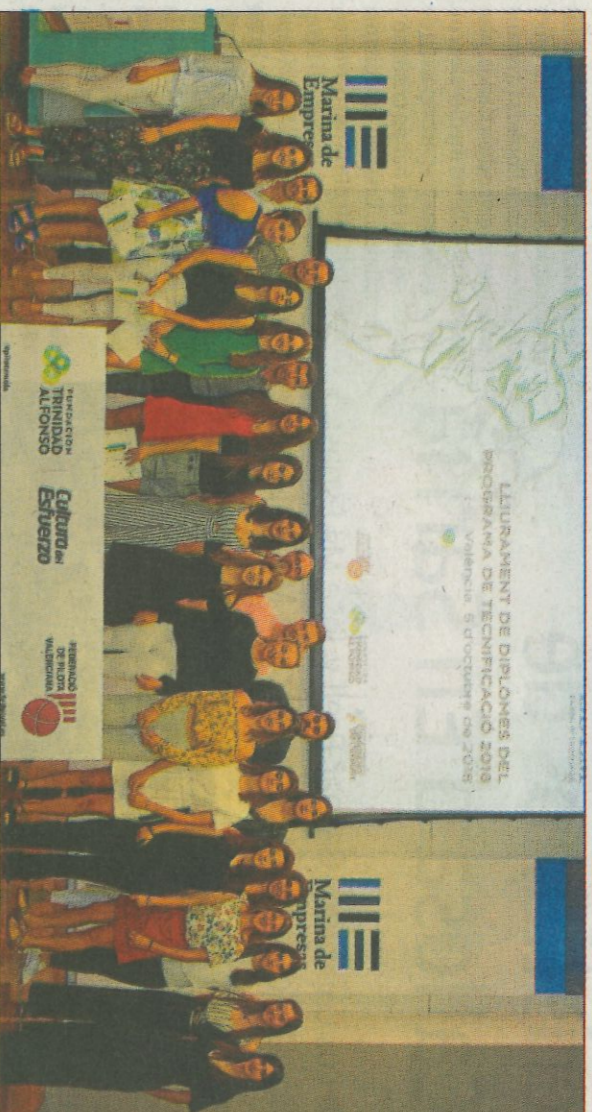
Els alumnes de l'Escola de Tecnificació de la Federació de Pilota Valenciana. FPV

La col·laboració entre la FPV i la FTA, materialitzada a través d'un conveni subscrit a principis de 2018, està oferint bons resultats. Gràcies a l'ajuda de la Fundación, ha nascut la tecnificació femenina. Un total de 19 jugadores de tota la Comunitat Valenciana s'han vist beneficiades amb beques per als desplaçaments que fan durant la temporada i amb material per aju- gar a pilota. «Una entitat com la nostra, tan centrada en potenciar l'esport valencianà, i volcada en con- vertir la Comunitat Valenciana en