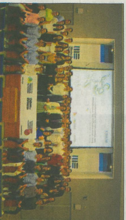
Els 75 alumnes junts als padrins a l'actar l'acte.

la Comunitat de l'Esport, ni podia ni havia d'oblidar el nostre esport autòcton. Així ens jo va transmetre el nostre president Juan Roig, i així estem fent-ho. Estem molt con- tents per contribuir a fer possible