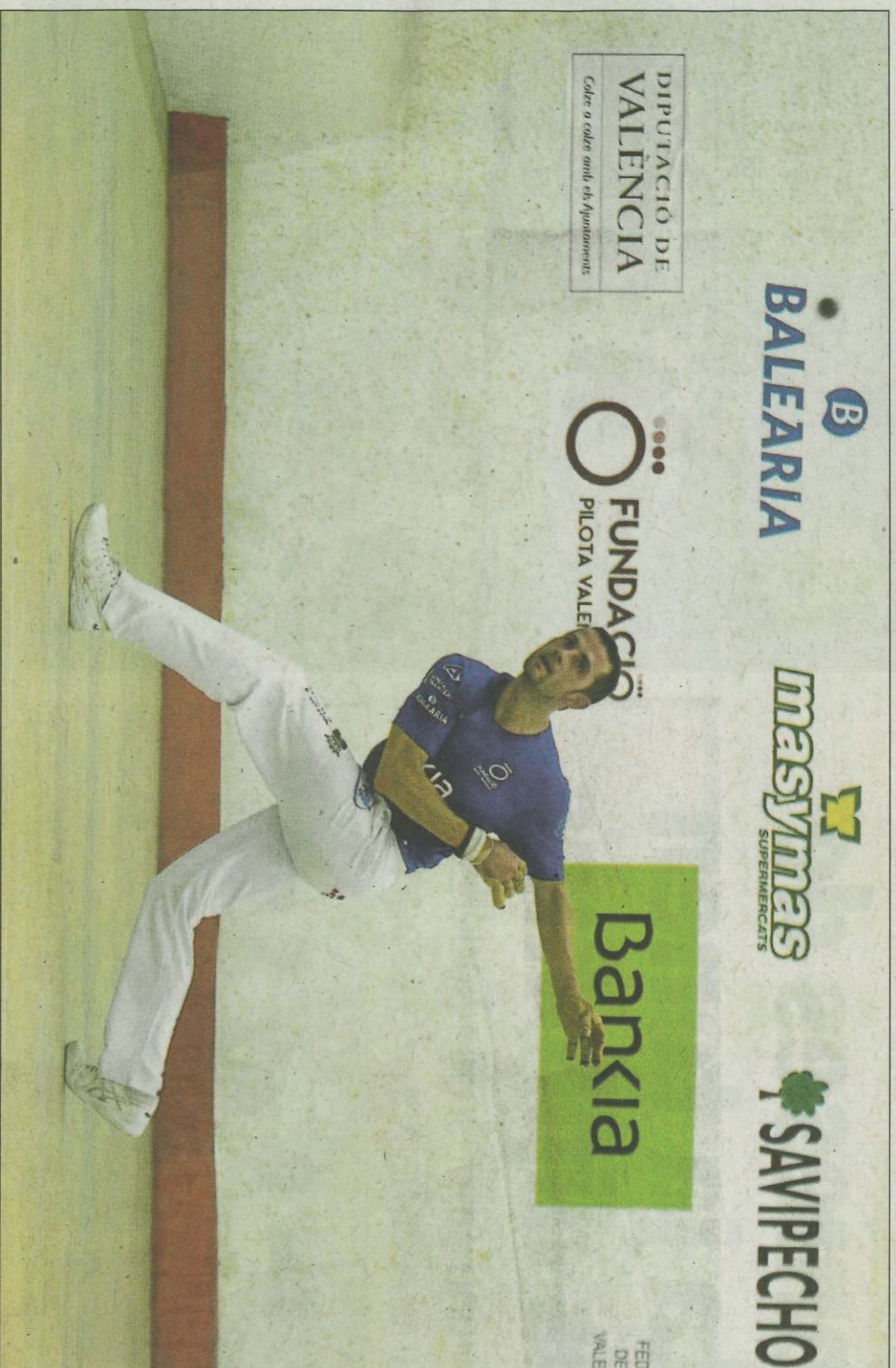
Una imatge poc habitual en la pilota, un mitger executant un rebot.