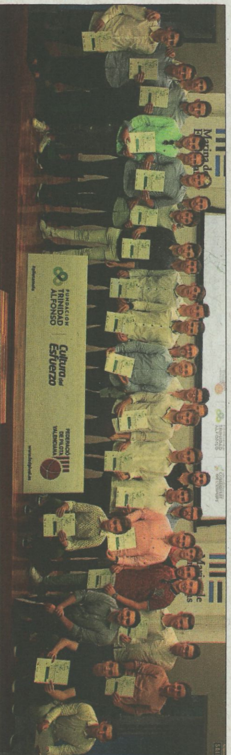
Alumnes d'escala i corda de tecnificació i CESPIVA amb els representants de Petrer, Massalfassar, Genovés i els seus monitors. F.P.V.

Promeses a seguir en el futur La tecnificació femenina ha destacat amb 19 xiques en el seu primer any