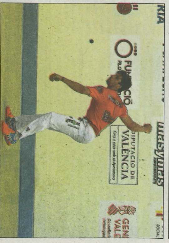
Puchol II s'enfronta hui a Soro III al trinquet de Massamagrell. FUNPIVAL

La partida començarà després d'una exhibició dels components del club de pilota local, programada a les 16 hores.