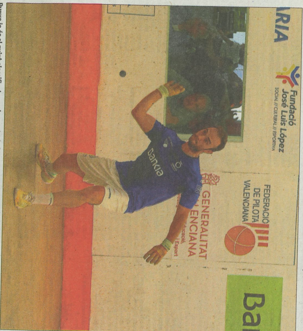
Punxa ja és el quint classificat per als quarts de final de l'Individual de raspall.

Finalment va sumar el de Piles, però en el quint val, la qual cosa demostra la igualtat que hi havia en la pista. En l'altre, el definitiu, Mira-