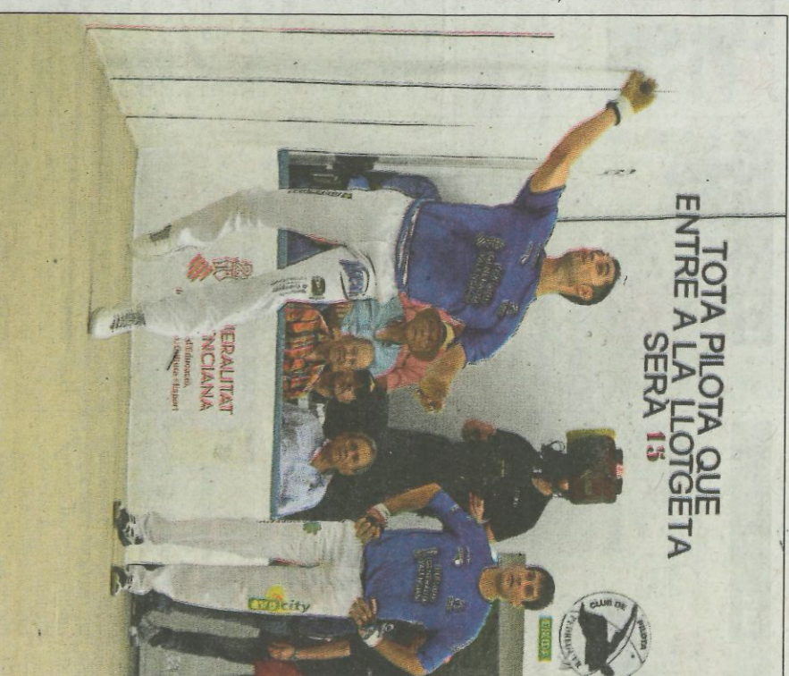
Pere colpeja de volea en un moment de la semifinal d'ahir.

TOTA PILOTA QUE ENTRE A LA LLOTGETA SERÀ 15