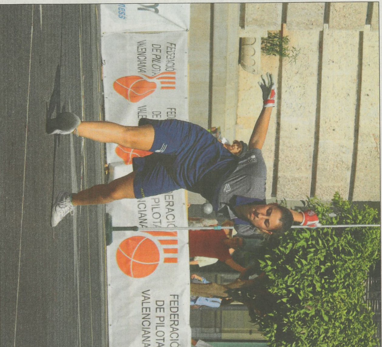
Moment de l'exhibició de la partida femenina en l'edició de l'any passat del Dia de la Pilota.

A anys després el Dia de la Pilota es va canviar a un dels darrers dinenges de setembre. «Des que estic en la Federació es fa a finals d'este mes. Nosaltres mantinem esta data perquè és la més adequada. Es el començament de curs, la gent ha tornat de vacances i poden acudir amb