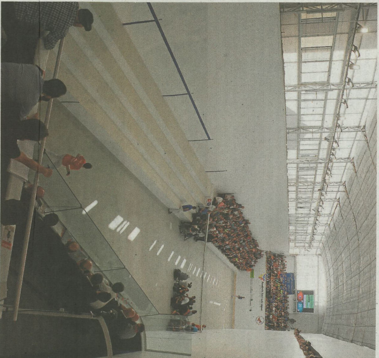
Vista panorámica del trinquet de Pelayo.

Una vez dentro del restaurante las paredes del mismo albergarán parte de otra exposición, 'Joc', de la que el jefe gráfico de este diario, Xema Rodríguez, es coautor junto al artista urbano Vinz Feel Free. Esta muestra, en su día alojada en el Cen-