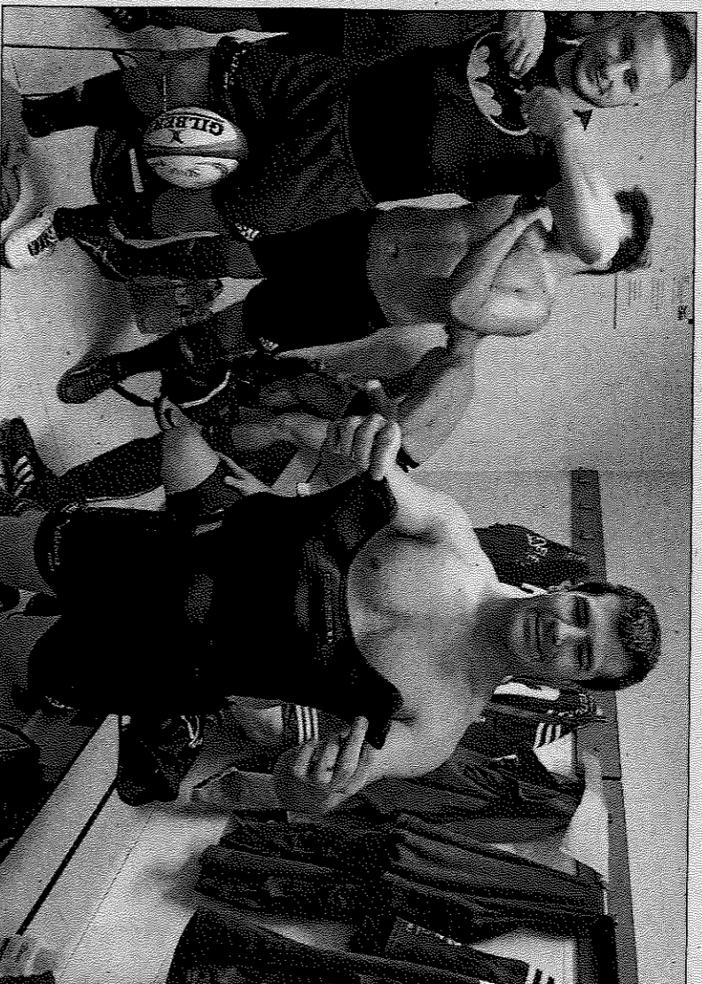
Un jugador del CAU muestra su chaleco en el vestuario antes del primer partido de Liga.