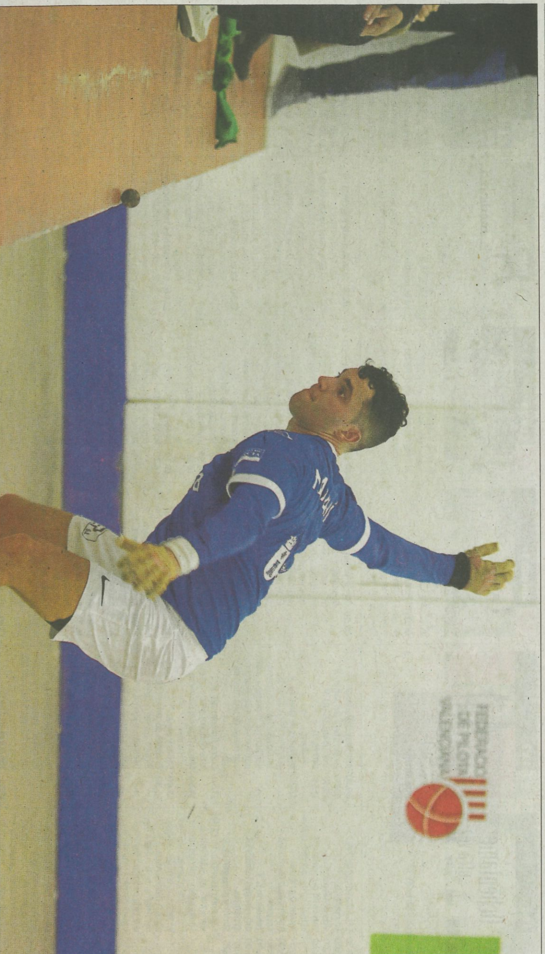
Marrahí assegura que amb la continuïtat ha recuperat la seua millor versió.